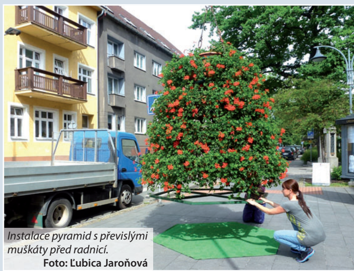
Instalace pyramid s převislými muškáty před radnicí.

Na záhonech ve městě už jsou také letničky, je jich bezmála sedm tisíc. Kromě náměstí v Novém Bohumíně jsou k vidění u pošty ve Skřečoni a na točně v Záblatí. Záhony zde zdobí cinie, rudbekie, afrikány či okrasný tabák. (tch)