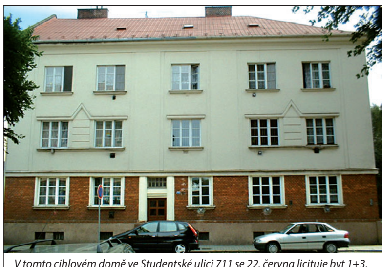
V tomto cihlovém domě ve Studentské ulici 711 se 22. června licituje byt 1+3.

● Byt 1+2, ul. Čs. armády 1044 , číslo bytu 11, I. kategorie, 4. nadzemní podlaží. Panelový nízkopodlažní dům naproti základní škole byl v letošním roce nově zateplen. Byt s plastovými okny a balkonem. Plocha pro výpočet nájemného 58,26 m 2 , celková plocha bytu 61,91 m 2 . Prohlídka 21.6. v 8.15–8.30 hodin a 22.6. v 15.15–15.30 hodin. Licitace bytu se koná 29.6. v 16.30 hodin.