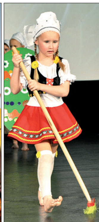
Na koncertu »Poděkování Vám« se tančilo, zpívalo či kouzličilo. Prodejci kvítků měli vstup zdarma, zakoupit si jej ovšem mohli i další zájemci.