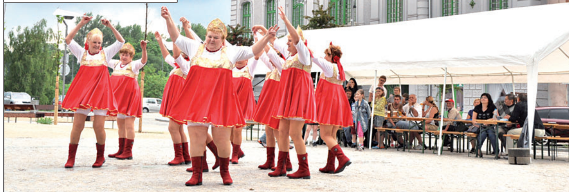
Zpestřením programu byly Mažoretky z Horní Lhoty. Seniorky mají věk nad 60 let a celkovou hmotnost téměř jedné tuny.