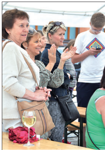
Slavnost na náměstí začínala za deště, ale přítomní se přesto skvěle bavili.

Spolek Přátel bohumínské historie v roli organizátora připravil také tombolu. Přispěli do ní padesátkou cen starobohumínští podnikatelé. Vydařenou akci završil ohňostroj. Organizátoři už nyní zvou na další akce v městské části – oslavy 760. města proběhnou 16. července a závody dračích lodí na Odře 27. srpna. (tch)