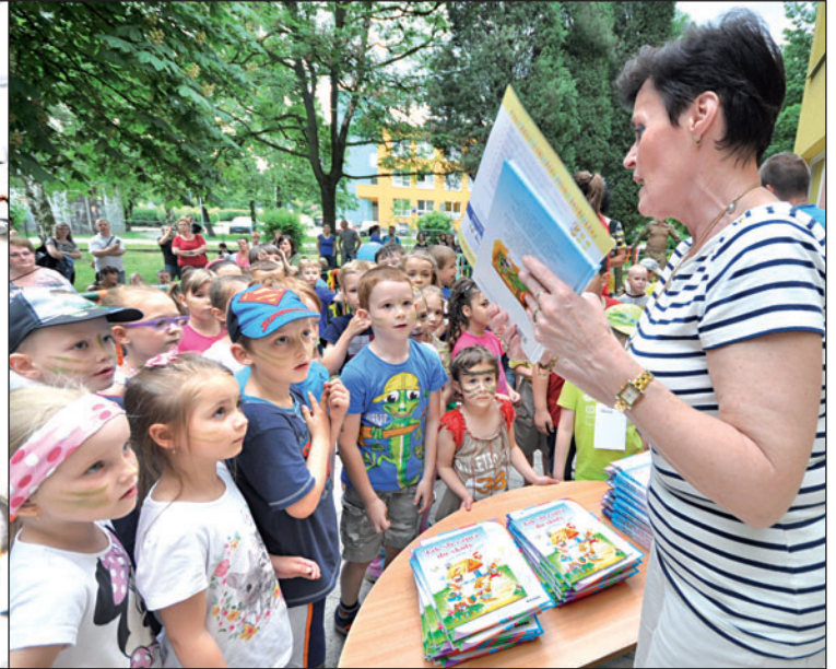
Při oslavě dne dětí se školka loučila s dětmi, které po prázdninách nastoupí do prvních tříd.

N erudova školka slavila Mezinárodní den dětí netradičně. Celodenní program měl podtitul »Trocha vojenské historie, která nikoho nezabije«. Dopoledne 1. června děti navštívily muzeum vojenské techniky, odpoledne je čekal pestrý program v zahradě mateřinky. Cílem bylo seznámit děti atraktivní formou s vojskem a obrannou funkcí armády.