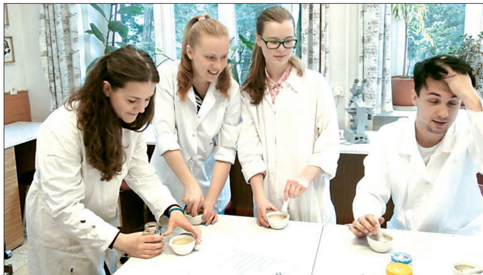
Na bohumínském gymnáziu proběhl česko-polský workshop.