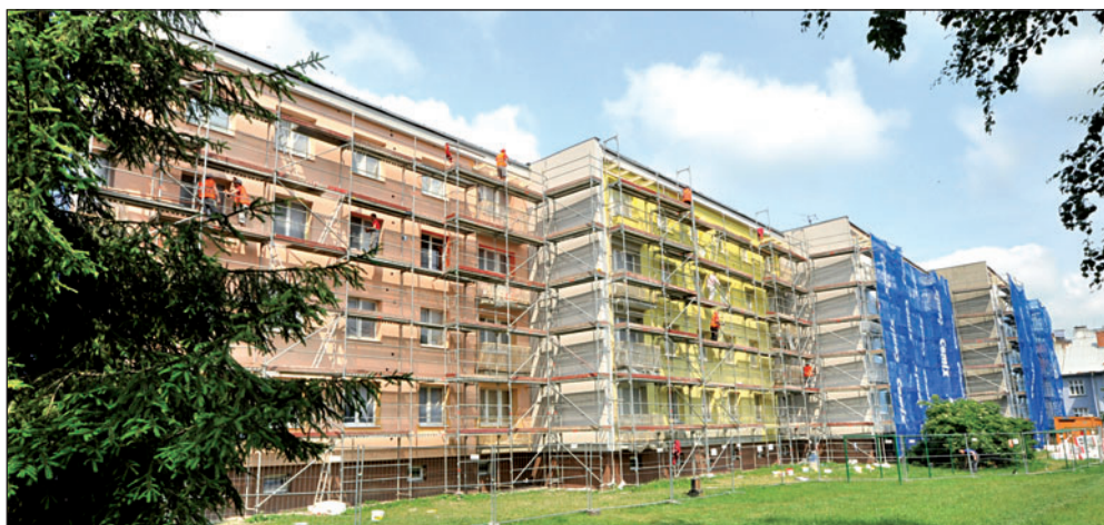
Nový kabát aktuálně získávají domy v Čáslavské ulici u Zmijova dvora nebo »hokejka« v ulici Čs. armády.

Oprava se zaměřuje hlavně na vnější části budov. V průběhu pěti měsíců se zateplení dočkají fasády, někde i střechy. Komplexní obnovou projdou i balkony či lodžie. Nové budou vchody do domů, dveře a zvonková tabla. Nejnáročnější rekonstrukcí právě prochází »hokejka« v ulici Čs. armády, dům s devíti vchody (číslo 1042 až 1050) a více než stovkou bytů. »Opravy tady potrvají až do lis-