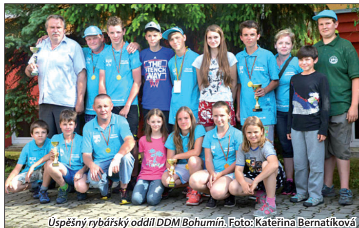
Úspěšný rybářský oddíl DDM Bohumín.

Kepákové a Adamu Vladykovi, třetí byl Filip Sitek. Po sečení bodů ve všech disciplínách obsadil ze čtyřadvaceti soutěžících