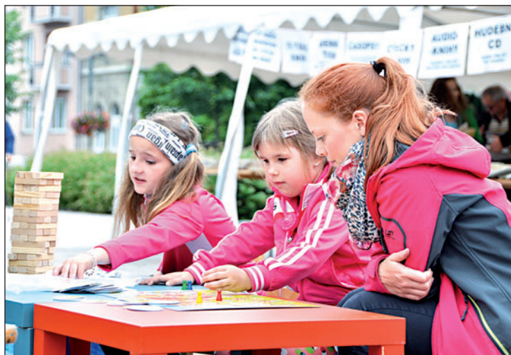
▲ Doprovodný program myslel na děti. Na náměstí probíhaly výtvarné dílny, hrály se různé hry. ▼ I v době internetu a čteček má klasická kniha stále své kouzlo. A to přilákalo do antikvariátu davy lidí.

Co s nimi? „V první řadě máme povinnost přebytečné tituly nabídnout jiným knihovnám. Když nemají zájem, přichází na řadu likvidace. My ale jdeme jinou cestou, nabídneme je lidem, knížky tak mohou dál sloužit a dělat radost,“ popsala myšlenku vedoucí knihovny Mag-