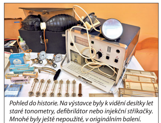
Pohled do historie. Na výstavce byly k vidění desítky let staré tonometry, defibrilátor nebo injekční stříkačky. Mnohé byly ještě nepoužité, v originálním balení.

V rámci doprovodného programu si zájemci mohli nechat změřit cholesterol, glykemii, krevní tlak či BMI (tělesný tuk, svalovou hmotu a vodu). Nechyběla ani praktická instruktáž srdeční masáže a umělého dýchání. (tch)