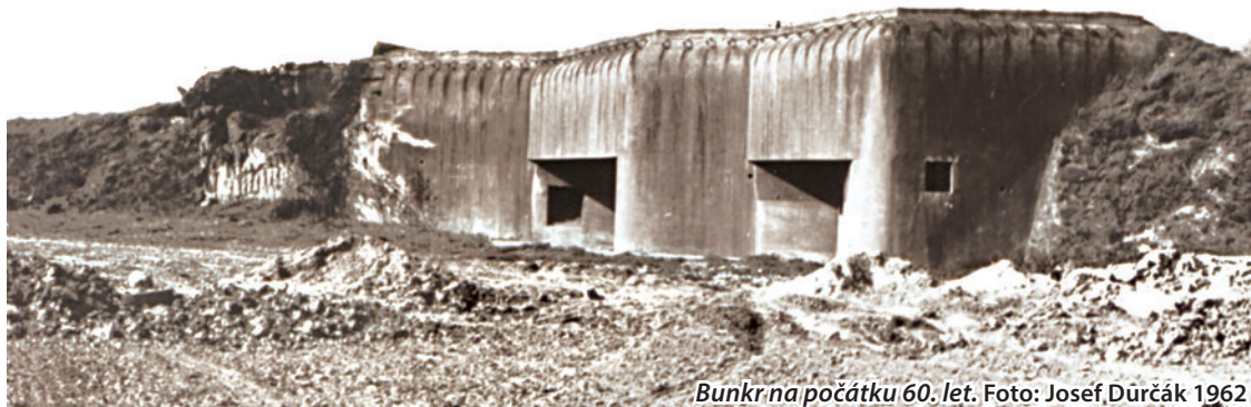
Bunkr na počátku 60. let. Foto: Josef Důrčák 1962

U příležitosti 80. výročí betonáže bunkru se bude 30. července konat »narozeninová« akce. Zároveň připomene zašlou slávu československého opevnění. Více o připravované akci na www.bunkr-bohumin.cz a facebooku. (hej)