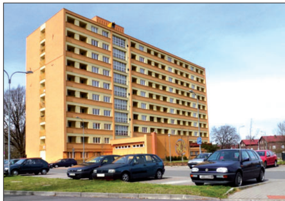
Licitace bytů ve Slunečnici v Okružní ulici 716 se mohou 8. srpna zúčastnit pouze ti zájemci, kteří si do 3. srpna podají přihlášku na majetkovém odboru. Od 15.45 hodin se licitují dva byty o velikosti 1+2 a 1+3.

• Byt 0+1, ul. Nádražní 718 , číslo bytu 7, I. kat., 3. nadzemní podlaží. Nízká cihlová zástavba naproti tržišti. V blízkosti je Penny market, vla-