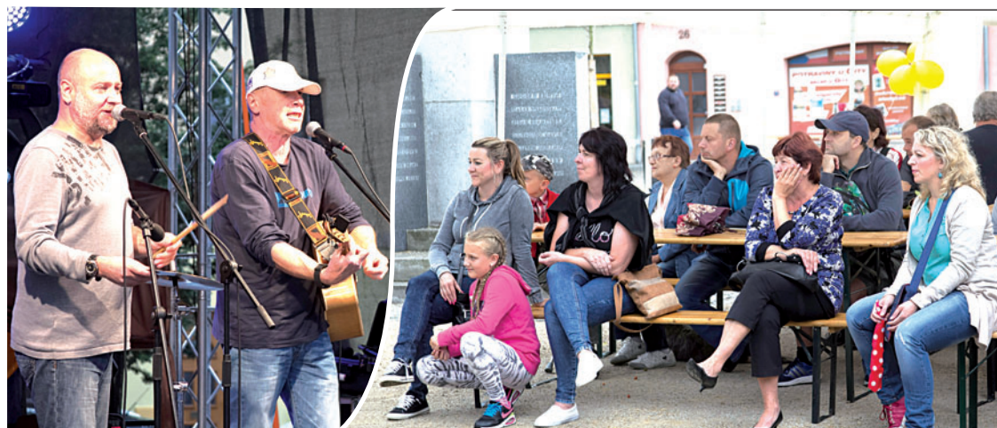
Na oslavách vystoupil i plzeňský Děda Mládek Illegal Band. Kvůli dešti přišly návštěvníkům vhod pláštěnky a partystany na náměstí.

Zájemci absolvovali i prohlídku zrekonstruovaného secesního domu Pod Zeleným dubem a nově otevřeného muzea. (balu, tch)