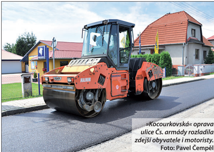
»Kocourkovská« oprava ulice Čs. armády rozladila zdejší obyvatele i motoristy.

Údiv a nechápavé pohledy motoristů i obyvatel ulice Čs. armády. V ní se ve druhé půli července objevili cestáři, vyfrézovali starý asfalt a položili nový. Nebylo by na tom nic divného, opravy cest jsou v létě časté a nový koberec kvitují řidiči s povděkem. Jenže povrch v ulici byl naprosto v pořádku a k přeasfaltování nebyl »logický« důvod.