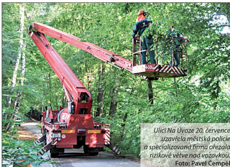
Ulici Na Úvoze 20. července uzavřela městská policie a specializovaná firma ořezala rizikové větve nad vozovkou.