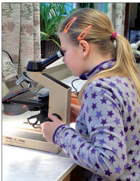
Kroužek mladých přírodovědců je pro talentované gymnazisty skvělou přípravou.

Akce, na které si žáci mohli prověřit i své výtvarné vlohy, se konala v rámci Dne Země. Šlo o celosvětovou kampaň, která upozorňuje na plýtvání jednorázovými kelímky. V celostátní soutěži získala škola díky fotografiím vyrobených exponátů první místo a zvláštní ocenění za vynikající kolekci výtvarných prací.