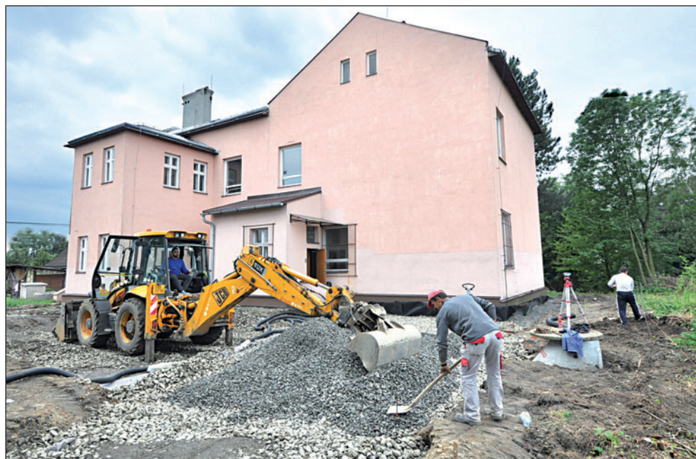
Rekonstrukce hřiště měla být rutinní záležitostí, ale stavbaře zaskočilo podloží. Bylo nutné vytvořit zcela nové.