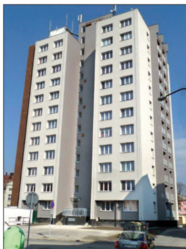
V tomto domě na tř. Dr. E. Beneše 1071 se 14. září licitují dva byty. Jeden o velikosti 0+1, druhý 1+3. Věžový dům stojí v centru města, je zateplený. Poblíž je Penny market, vlakové a autobusové nádraží.

● Byt 1+3, tř. Dr. E. Beneše 1071 , číslo bytu 38, I. kategorie, 7. nadzemní podlaží. Věžový, celkově zateplený dům s výtahem v centru města, v blízkosti se nachází Penny market, Kaufland, vlakové a autobusové nádraží. Byt s plastovými okny, ústředním vytápěním a balkonem. Plocha pro výpočet nájemného 66,97 m 2 , celková plocha bytu 68,64 m 2 . Prohlídka 12.9. v 14.45–15.00 hodin