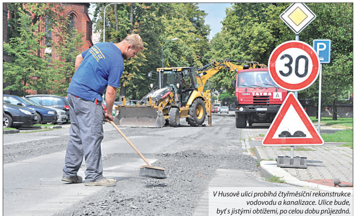
V Husově ulici probíhá čtyřměsíční rekonstrukce vodovodu a kanalizace. Ulice bude, byť s jistými obtížemi, po celou dobu průjezdná.