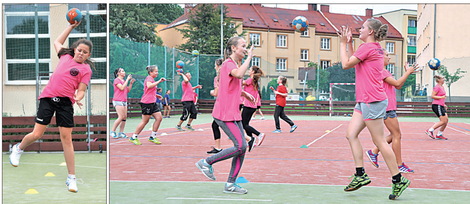
Tréninky mladých házenkářek probíhaly za hezkého počasí na hřišti Masarykovy školy. Následně se přesunou pod střechu sportovní haly za parkem.