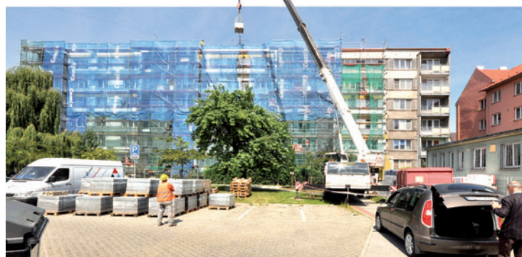
Čelní strana domu v Komenského ulici už vykoukla zpoza plent. Ve dvorní části je ale stále hodně práce.

Jde o problém, který se na stavbách objevuje pravidelně. Firmy nasazují omezený počet dělníků a spoléhají na to, že termín jakž takž stihnou. „Je to každý rok stejné. Téměř při každém kontrolním dni apelujeme na firmy, aby směny na stavbách posílily. Do samotného postupu prací jim ale mluvit nemůžeme, důležitý je termín dokončení.“