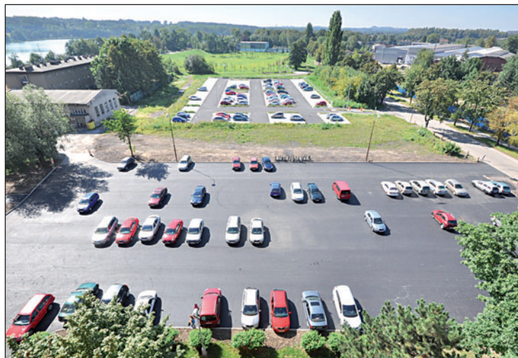
Parkoviště původně sloužilo výhradně pracovníkům železáren, bylo oplocené a místní obyvatelé jej využívat nemohli. Firma si ale v sousedství postavila parking nový. Zrekonstruované parkoviště přímo u věžáků už je nyní veřejné.

sotva ze staveniště zmizely původní zábrany. A když dorazili asfaltéři, byl je problém z parkingu dostat. „Opakovala se situace