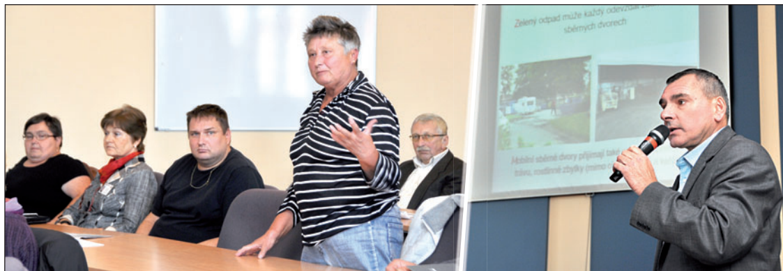
Na radnici proběhla veřejná debata k navrženým změnám systému svozu zeleného odpadu.

Bohumín zruší osmadvacet bezplatných stanovišť pro sběr zeleného odpadu. Dosavadní systém se neosvědčil a město s BM servisem proto připravilo alternativní řešení. Zlevnění odvozu bioodpadu přímo od zahrad, které v Bohumíně funguje od roku 2011, a mírnější podmínky ekologické kampaně, díky níž mohou domkaři získat slevu na svoz hnědých popelnic.