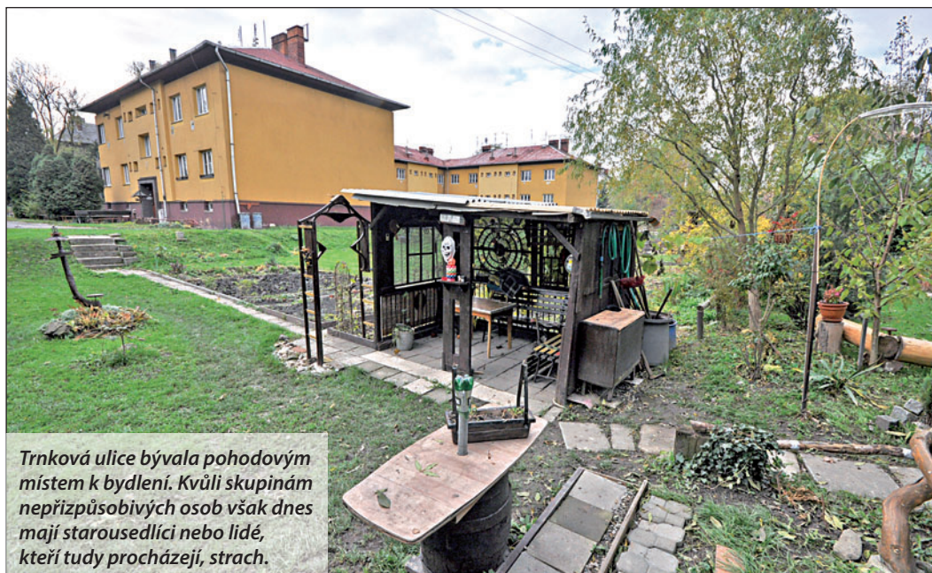
Trnková ulice bývala pohodovým místem k bydlení. Kvůli skupinám nepřizpůsobivých osob však dnes mají starousedlíci nebo lidé, kteří tudy procházejí, strach.

! Zlepšení situace opakovaně požadovalo město jak po vedení OZO, tak uřgovalo řešení to-