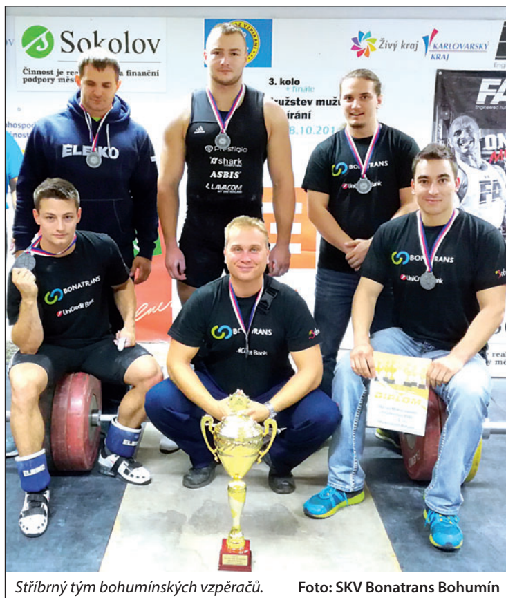
Stříbrný tým bohumínských vzpěračů.