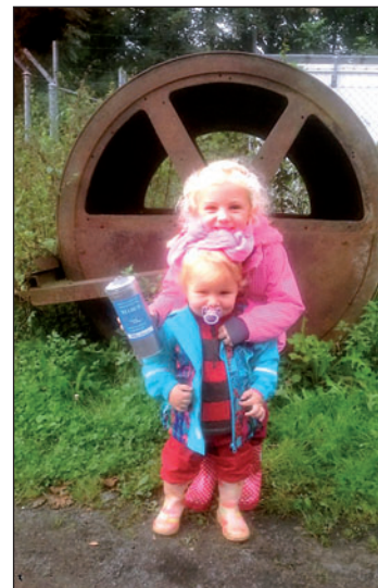
Objevitelé jednotlivých kešek neskrývali radost.