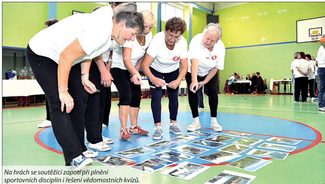
Na hrách se soutěžící zapojují při plnění sportovních disciplín i řešení vědomostních kvízů.

Dříve narození Bohumíňáci mají soutěživého ducha. Důkazem jsou každoroční zábavné – sportovní hry seniorů, letos se konal už jejich jubilejní 10. ročník. Do tělocvičny a areálu základní školy ČSA zavítalo 15. října 88 účastníků, z nichž nejstaršímu bylo 80 let. O hladký průběh her se staral 22členný pořadatelský tým.