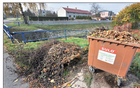
Bezplatné kontejnery se neosvědčily. Je vedle nich nepořádek, který tleje a zapáchá.