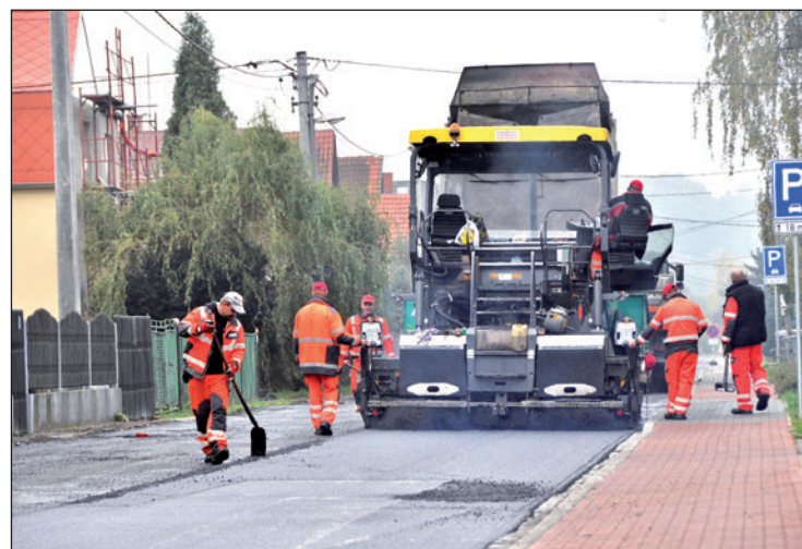
Asfaltěři položili v říjnu v Mládežnické ulici nový koberec.

V Mládežnické se loni a letos po etapách rekonstruovaly chodníky. Rozpraskaný litý asfalt nahradila zámková dlažba. Dalším krokem dopravních inovací v ulici