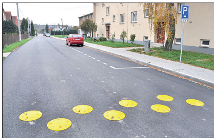
Na vozovce přibyl účinný systém polštářových zpomalovacích retardérů.

jeden efekt. Mohou odradit řidiče, kteří se při cestě ze Záblatí po Rychvaldské ulici chtěli vyhnout provozu v ulici 1. máje a zkracovali si cestu přes obytnou zónu. (tch)