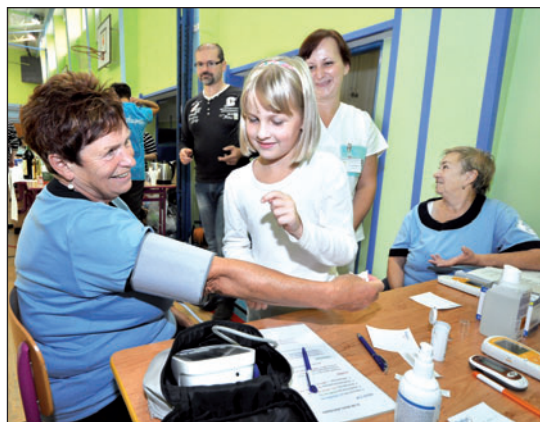
Nemocnice připravila koutek zdraví, tedy měření cholesterolu, tlaku či cukru v krvi.

Organizátoři her děkují sponzorům akce a zvláštní poděkování věnují Bohumínské městské nemocnici, jejíž »koutek zdraví« byl opět v obležení. (tch)