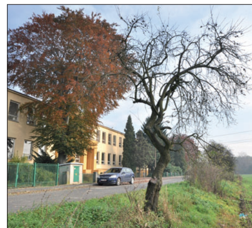
Jeden z podnětů občanů se týkal starých ovocných stromů u základní školy v Pudlově. Jejich případnou probírku odborníci posoudí.

! Monitory kamerového systému sleduje podle možností dozorcí městské policie a současně je může sledovat služba konající policista bohumínského oddělení Policie ČR. Ze všech kamer pak existují několikátýdenní záznamy, v nichž lze podle potřeby události dohledat. Záznamy se dají zpětně také přiblížit.