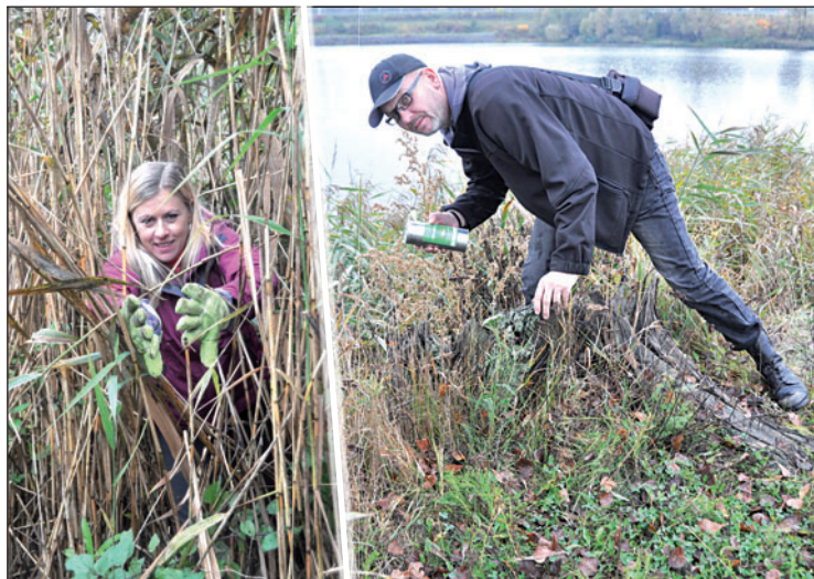
Holínky, rukavice a důmyslná kamufláž. »Bojovku« zažívali také organizátoři.

pozornost. Například zahrát etudu zbloudilých turistů, kteří se ptají na cestu, nebo náruživých fotografů vodních ptáků. Nejtěžším oříškem byli »samozvaní hlídači«, obyvatelé odlehlých končin, kteří ostrším zrakem sledovali všechny »vetřelce« v jejich teritoriu. Ovšem i pod jejich nosem se podařilo schránky ukrýt.