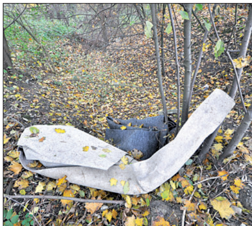
Přestože funguje stabilní sběrný dvůr i ty mobilní, řada barbarů se zbavuje odpadu v přírodě a zakládá černé skládky.

hoto nepříznivého stavu po zřizovateli, kterým je město Ostrava. Společnost OZO na podněty města reaguje a přistoupila už k některým nápravným opatřením. Bohumín ale dodnes neobdržel odpověď na dopis adresovaný Ostravě, který byl odeslán ještě před konáním veřejných setkání v městských částech.