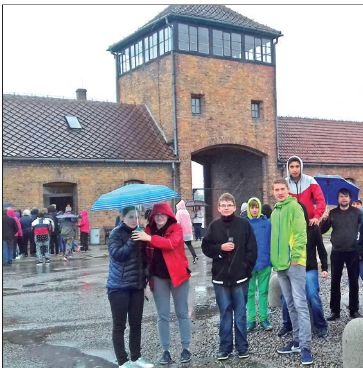
Žáci Masarykovy školy navštívili v říjnu koncentrační tábor v Osvětimi.

Hlavní akcí byla beseda o říjnové exkurze koncentračního