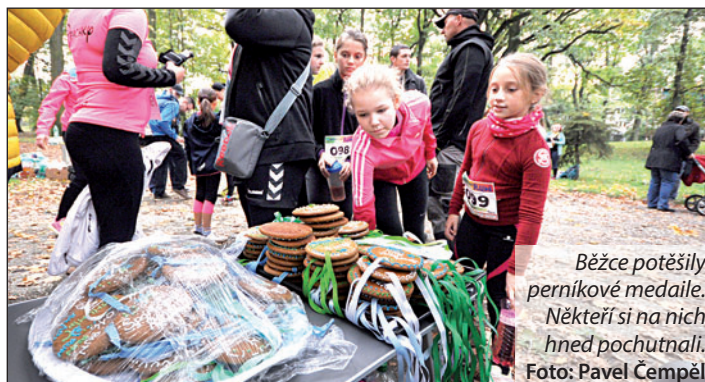
Běžce potěšily perníkové medaile. Někteří si na nich hned pochutnali.