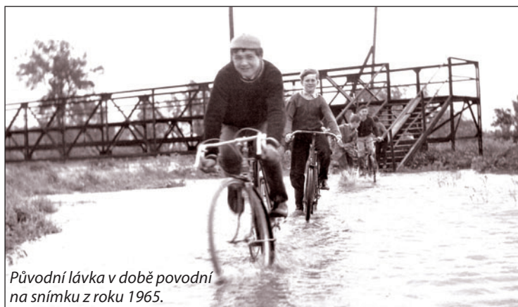
Původní lávka v době povodní na snímku z roku 1965.