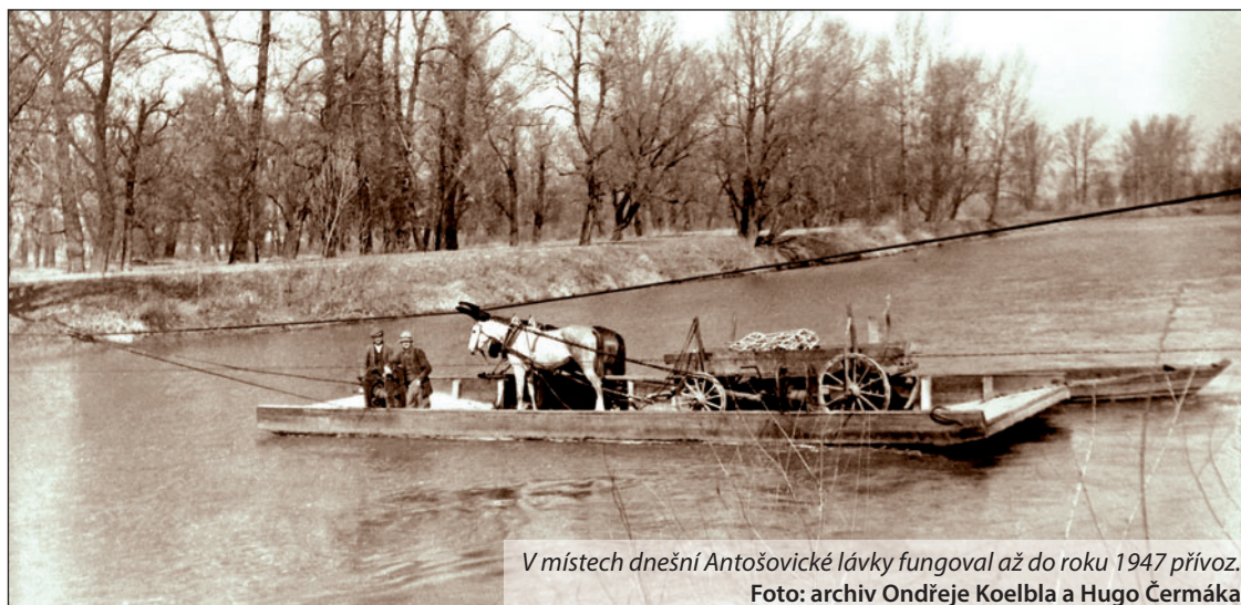
V místech dnešní Antošovické lávky fungoval až do roku 1947 přívoz.

Převozník měl na levém břehu řeky i malý dřevěný přístavek. Přívoz měl daný jízdní řád, který respektoval směny pracujících