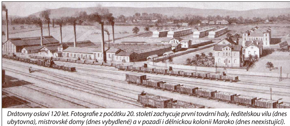
Drátovny oslaví 120 let. Fotografie z počátku 20. století zachycuje první tovární haly, ředitelskou vilu (dnes ubytovna), mistrovské domy (dnes vybydlené) a v pozadí i dělnickou kolonii Maroko (dnes neexistující).

85 let od založení Atletického fotbalového klubu Nový Bohumín - Faja (1932; dnes FK Bospor Bohumín)