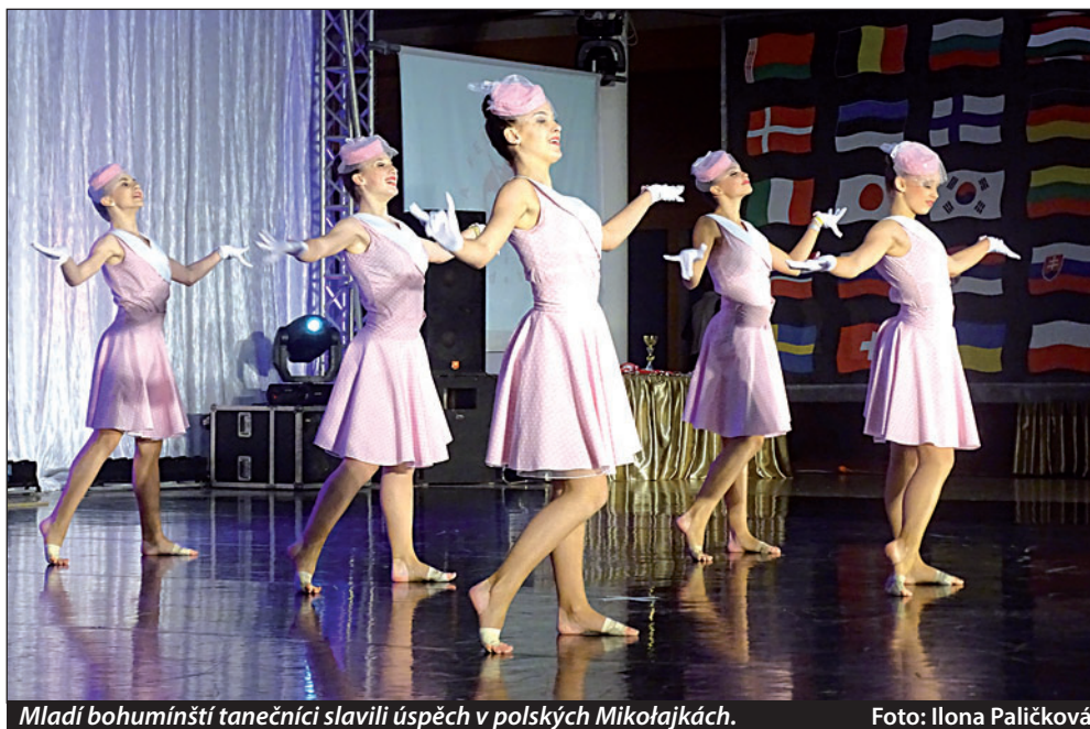
Mladí bohumínští tanečníci slavili úspěch v polských Mikołajkách.

Nyní začíná souboru Radost & Impuls tříměsíční období práce nad novým repertoárem pro letošní rok. Výsledky práce choreografů, trenérů, tanečnicků, švadlen, zvukařů