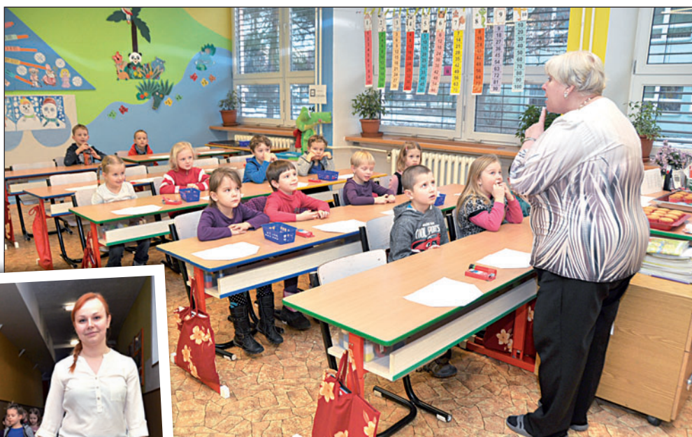
Budoucí prvňáčci zavítali 26. ledna do školy ČSA. Poprvé usedli do lavic a naučili se písničku. V rámci akce »Budu školákem!« si děti prohlédly školu a zadováděly si v tělocvičně.