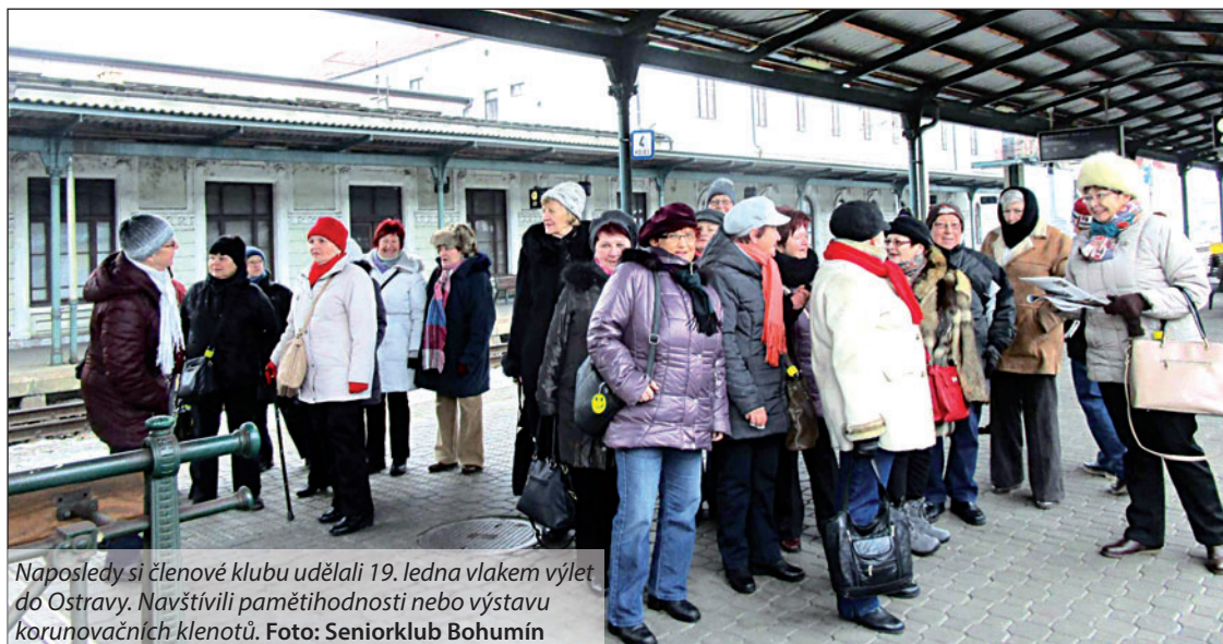
Naposledy si členové klubu udělali 19. ledna vlakem výlet do Ostravy. Navštívili pamětihodnosti nebo výstavu korunovačních klenotů.