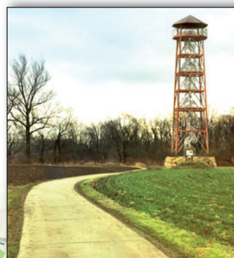
Vizualizace 27 metrů vysoké rozhledny, která vyroste na polském břehu Odry.