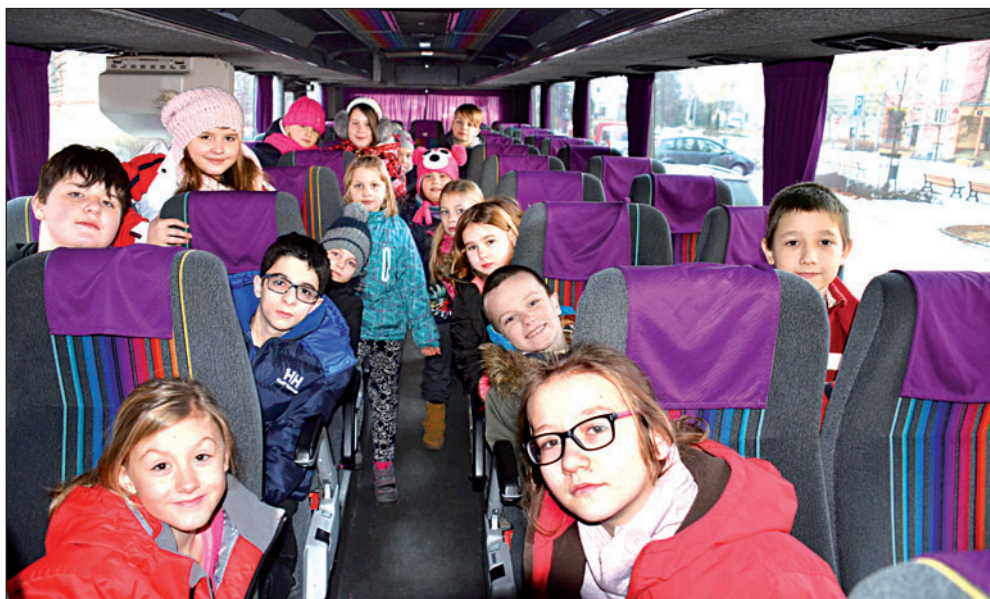
Dvacítka bohumínských dětí vyrazí za čistým vzduchem do Metylovic na Frýdecko-Místecku.

Dopravu do léčeben platí město, samotný pobyt v podhůří hor dětem hradí v plné výši zdravotní pojišťovny. Léčebné pobyty Bohu-