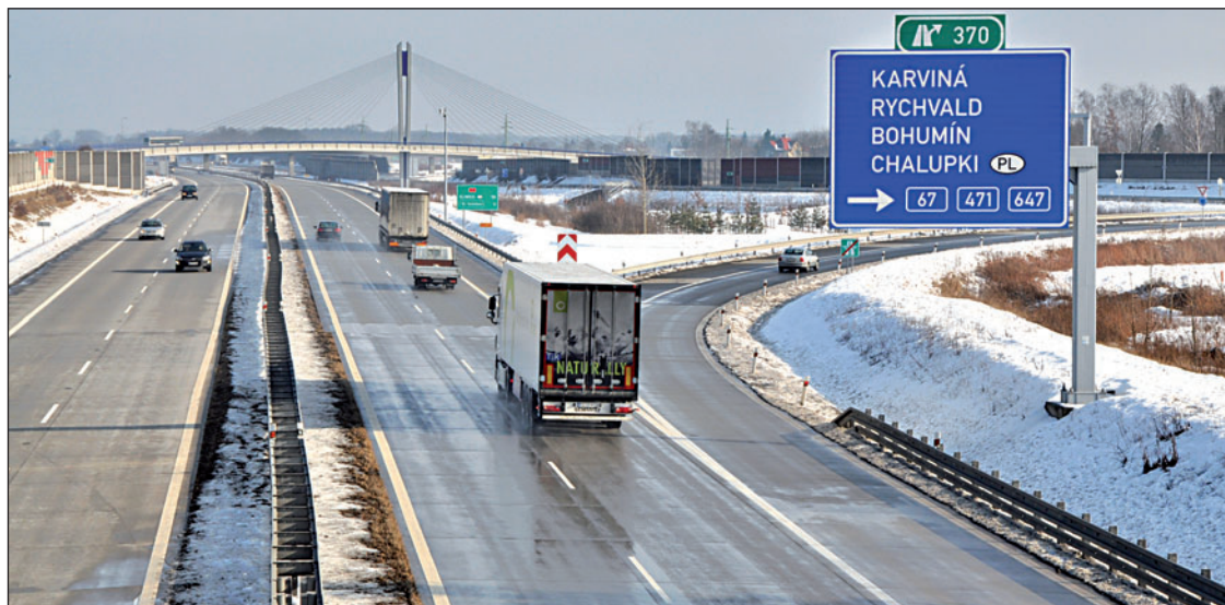
Dálnice je stále ve zkušebním provozu. Před kolaudací musí podstoupit opakované měření hladiny hluku.