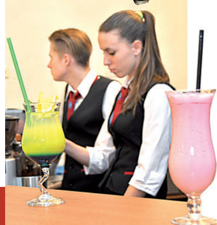
Střední škola se prezentovala v plné parádě. Den otevřených dveří zpestřilo klání kadeřníků a kuchařů-číšníků.