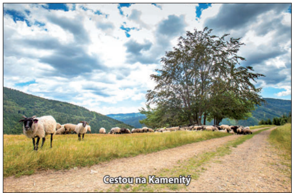
Cestou na Kamenitý