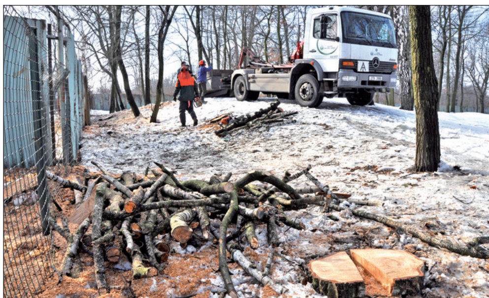
Kácení probíhá nejčastěji v období vegetačního klidu, tedy v zimě. V rámci údržby zeleně zahradníci v těchto dnech odstraňovali například suché břízy v Rafinérském lesíku.

Kácením uvolněné plochy se město snaží opět doplňovat vhodnou výsadbou. Loni v Bohumíně přibýlo 193 keřů a 67 stromů, z toho 38 listnatých a 29 jehličnatých. I když v uplynulém roce městští zahradníci méně stromů vysadili než vykáceli, v součtu uplynulých let množství nových stromů značně převyšuje počet odstraněných. (tch)