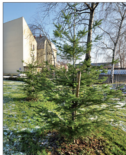
Z jehličnanů se nyní vysazují hlavně douglasky. Nově přibly také poblíž starobohumínského náměstí.

V roce 2016 byly v Bohumíně nejčastěji káceny topoly, šlo zároveň o stromy nejmohutnější. Dále to byly břízy, jasan, smrky a borovice. Zmíněné jehličnany jsou kvůli kůrovcové kalamitě už několik let nejrychleji mizející skupinou dřevin. Město se je snaží nahrazovat odolnějšími typy, hlavně douglaskami a smrkem omorika z Balkánu. Další významnou skupinou kácených stromů jsou ovocnany. Jde většinou o jednotlivé kusy, často pozůstatky velmi starých výsadeb. Radnice vyhověla také některým požadavkům na kácení ze strany občanů, ovšem pouze v odůvodněných případech.