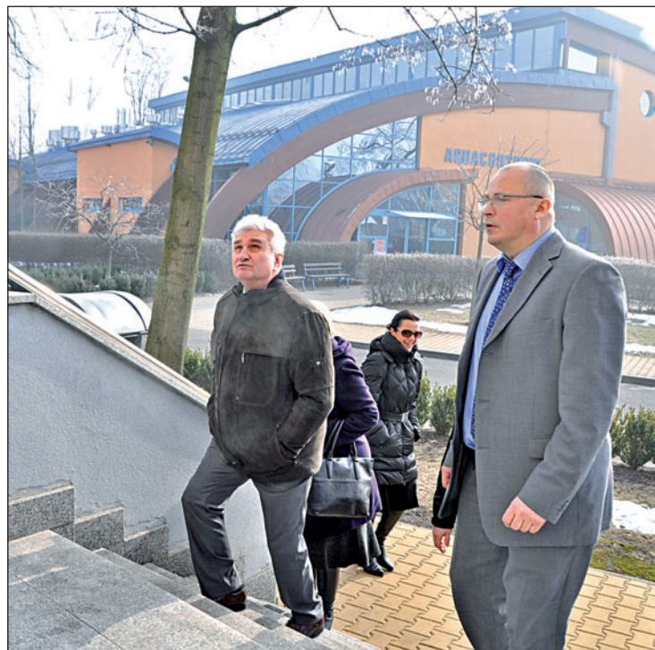
Představitelé Bohumína ukázali Milanu Štěchovi mimo jiné areál Bosporu, tedy penzion v bývalém vodojemu, aquacentrum a sportovní halu.

Milan Štěch při své návštěvě věnoval pozornost také zdravotnictví, financování a rozvoji obcí nebo školství. Setkal se proto s místními gymnazisty a společně se bavili o fungování Senátu i systému středoškolského i vysokoškolského vzdělávání. Jak podotkl, mezi priority Senátu patří hledání cest, jak vyjit vstříc právě obcím a jejich občanům. „Většina zákonů, které Senát vrací Poslanecké sněmovně, se týká nebo nějakým způsobem dopadá na obce a kraje, potažmo život jejich obyvatel. Ve většině případů se daří přesvědčit o našich argumentech poslance a prosadit opravy zákonů navržené Senátem,“ řekl předseda.