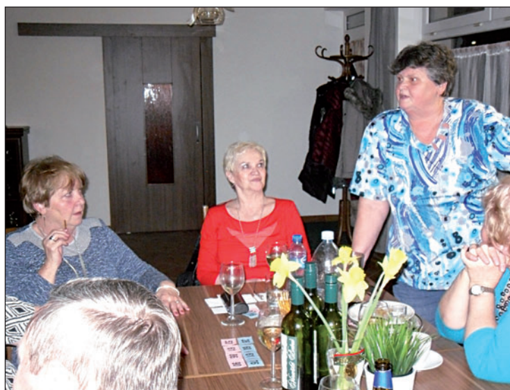
Soutěž vypravěčů vtipů.