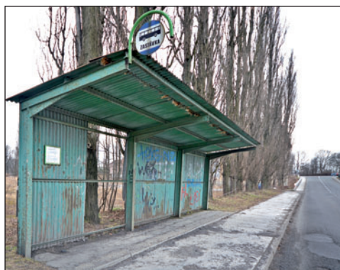
Nedůstojná plechová bouda letos zmizí i z Lidické ulice.

V Bohumíně je na sedmdesát autobusových zastávek, z toho necelá padesátka zastřešených. Město se v uplynulých letech pustilo do