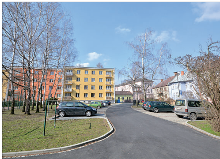
Další z vnitrobloků má důstojnou podobu. Poslední etapou přestavby Zmijova dvora byla výstavba parkoviště a oprava komunikace.

přibylo i »hnízdo« pro separační kontejnery, rozšířil se počet lamp a došlo také na výsadbu několika desítek keřů.