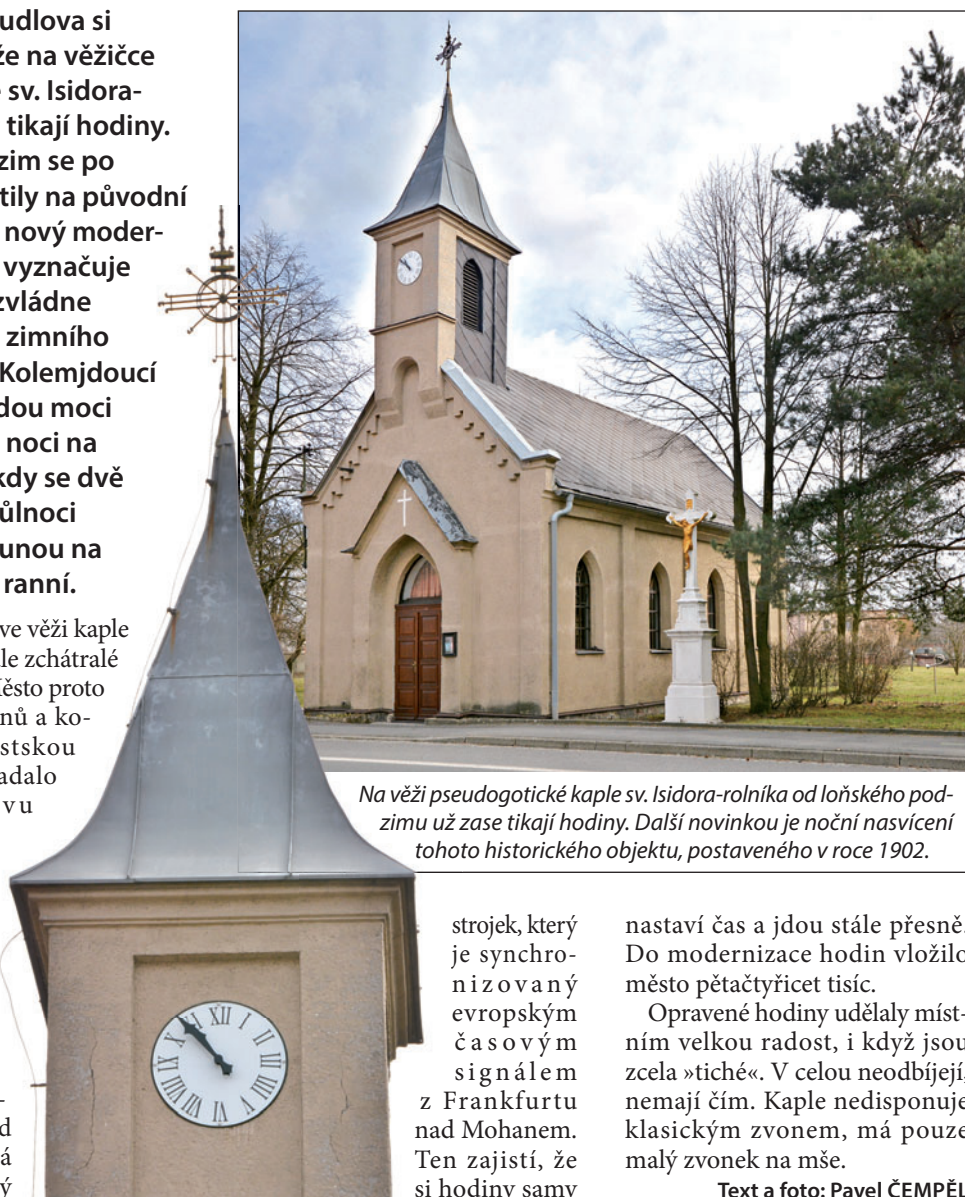
Na věži pseudogotické kaple sv. Isidora-rolníka od loňského podzimu už zase tikají hodiny. Další novinkou je noční nasvícení tohoto historického objektu, postaveného v roce 1902.

Hodiny sice ve věži kaple už dříve byly, ale zchátralé a nefunkční. Město proto na přání občanů a komise pro městskou část Pudlov zadalo jejich opravu a modernizaci. Časomíra tak dostala zcela nový smaltovaný ciferník o průměru 70 centimetrů s černými nerezovými ručičkami. O chod hodin se stará elektronický