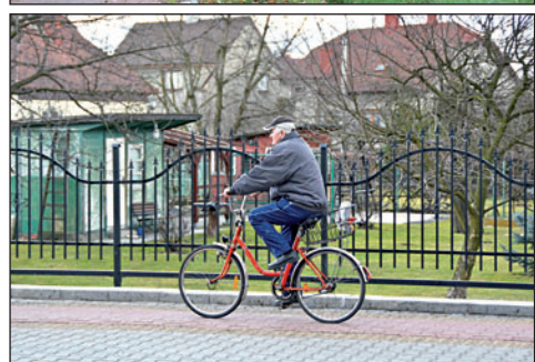
▲ Jízda po některých cyklostezkách, například v ulici Šunychelské nebo 1. máje, popravdě není tak komfortní jako po hladkém asfaltu na silnici. Jisté nepohodlí ale kompenzuje bezpečnost. Pokud jezdci respektují daný směr, nejezdí v protisměru a neriskují tak karambol.