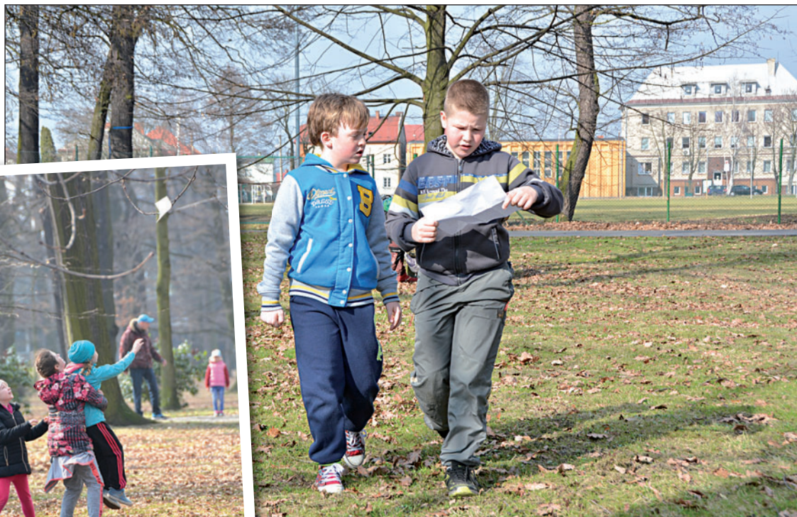
Jedno odpoledne strávili účastníci sportovního tábora v městském parku. Hledali ukrytá vodítka a pomocí Morseovy abecedy luštili vzkaz.

Děti mají za sebou týden prázdnin. Ty z Karvinska nemusí vůbec litovat, že na ně přišla řada až v rámci posledního celorepublikového termínu. Dočaly se příjemného počasí, a prázdniny tak měly oprávněně přívlastek »jarní«. Někteří školáci trávili volno s rodinou, rodiče si vzali dovolenou a vyrazili si na týden někam užít. Další skupinu školáčků dostaly na hlídání babičky. Byla tady ovšem ještě jedna možnost – využít nabídky městských organizací a strávit týden zábavy a her.