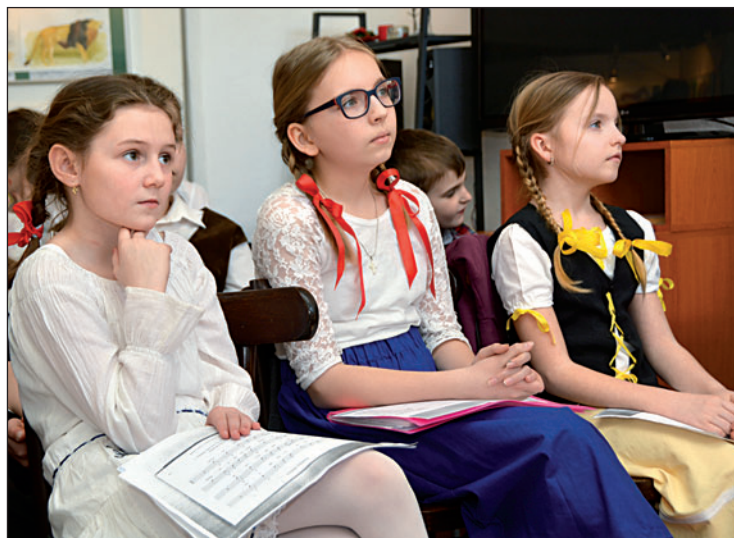
Lidovým písním sluší kraj. I vzhled vystupujících hraje při hodnocení svou roli.

Tříčlenná porota to neměla při rozhodování lehké, protože do dalšího kola mohla poslat z každé kategorie pouze jednoho vítěze. Regionální přehlídka se usku-