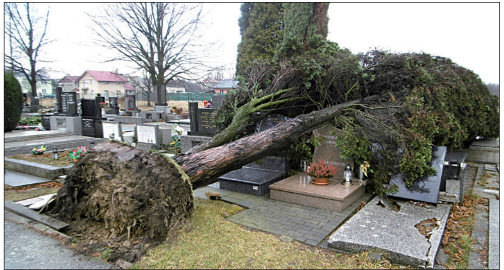
»Hřbitovní« túje často nadělají více škody než užítku. Naposledy se vlivem silného větru vyvrátily v Záblatí. Naštěstí tady nenapáchaly velké škody.