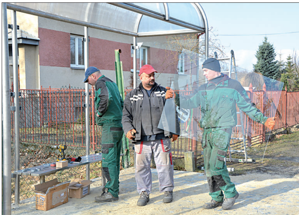
Poslední zastávku na trase do Šunychlu a Kopytova řemeslníci dokončili počátkem března u diagnostického ústavu.