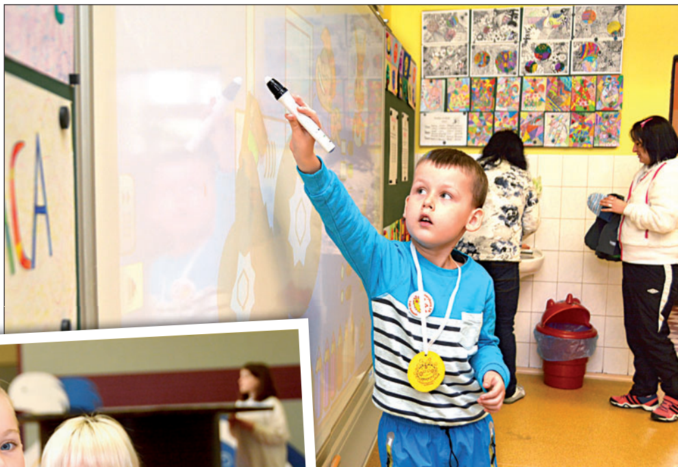
Na Masarykovu školu přišlo tentokrát k zápisům třiapadesát dětí. V tělocvičně je tradičně čekala pohádková stezka.

Od posunutí zápisů si ministerstvo slibovalo, že děti budou o něco vyzrálejší a tolik rodičů nebude pro své potomky žádat odklad nástupu do školy. V Bohumíně však tato argumentace vyhořela na celé čáře. Zatímco v roce 2015 zde činil počet odkladů třináct procent, loni to bylo jen šest procent. „Letos přišlo k zápisům 191 dětí a pro 27 z nich žádají rodiče odklad. To je obrovské číslo, představuje čtrnáct procent,“