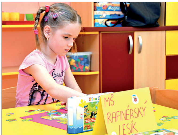
Skládání puzzlů děti baví a rády si v této disciplíně také zasoutěží.