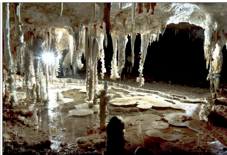
Vlevo odběry vzorků vody, Dom bivaku. Vpravo jezírko s aragonitovými krystalickými formami.