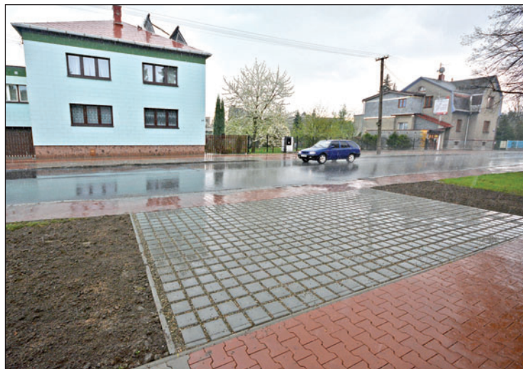
Mezi cyklostezkou a opraveným chodníkem vznikly vydlážděné plochy pro automobily. Stály jeden milion, stejnou částku si předtím vyžádala rekonstrukce popraskaného asfaltového chodníku.

Poslední etapa završila dopravní řešení mezi silnicí a obytnými domy v Šunychelské ulici. Na podzim 2015 a na jaře následujícího roku proběhla oprava chodníku. Nyní přišly na řadu odstavné plochy pro automobily.