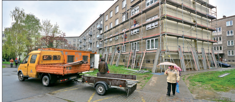
Už v dubnu odstartovaly práce v ulici Čs. armády u domů číslo 1056 až 1058.