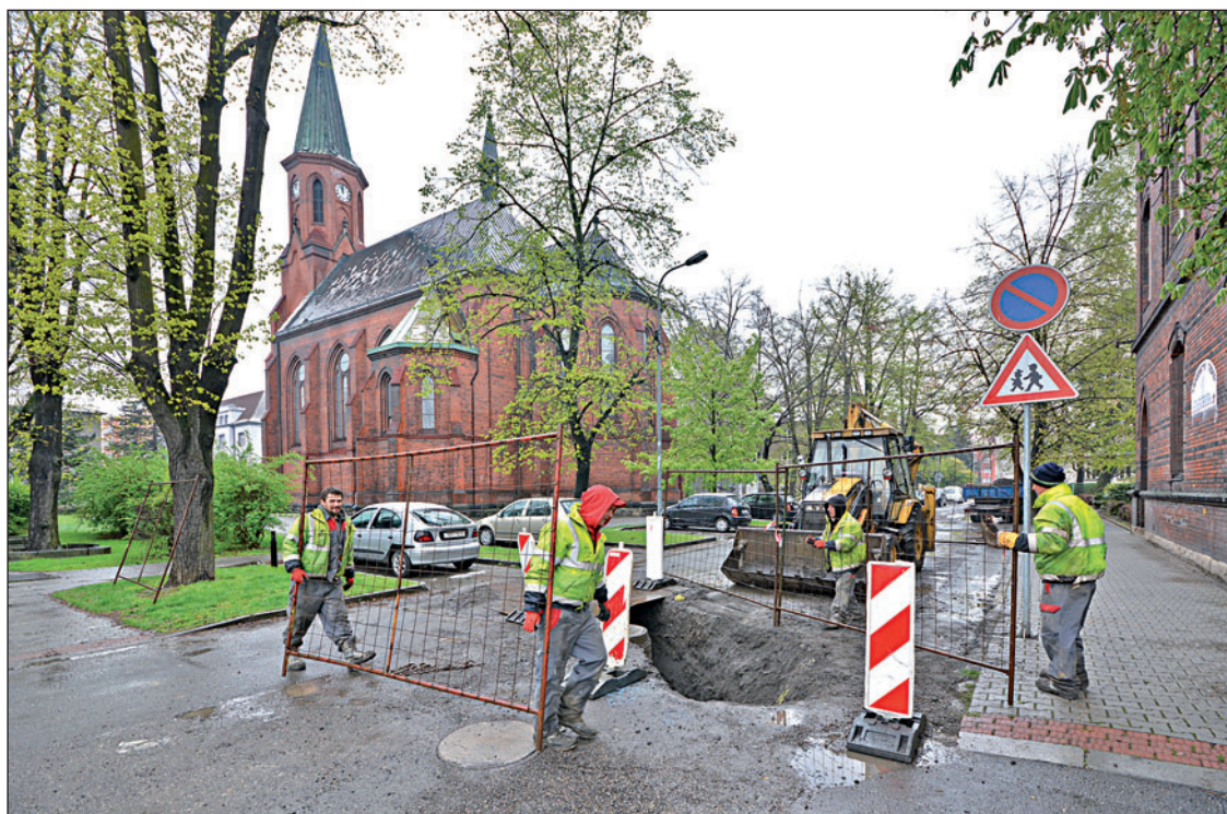
V Husově ulici probíhaly poslední úpravy, který se týkaly například instalace kanálových vpustí. Poslední fází bude pokládka asfaltového povrchu.

Jakmile asfaltéři proces oprav završí, šoféři i obyvatelé si oddechnou. Nepohodlí si užili dost. Cesta byla v uplynulých třech letech rozkopaná několikrát, kvůli pokládce teplovodu nebo havárii kanalizace. Nyní je pod povrchem vše nové, a pokud se nestane nějaká mimořádná událost, v ulici by mohl být několik desítek let klid. (tch)