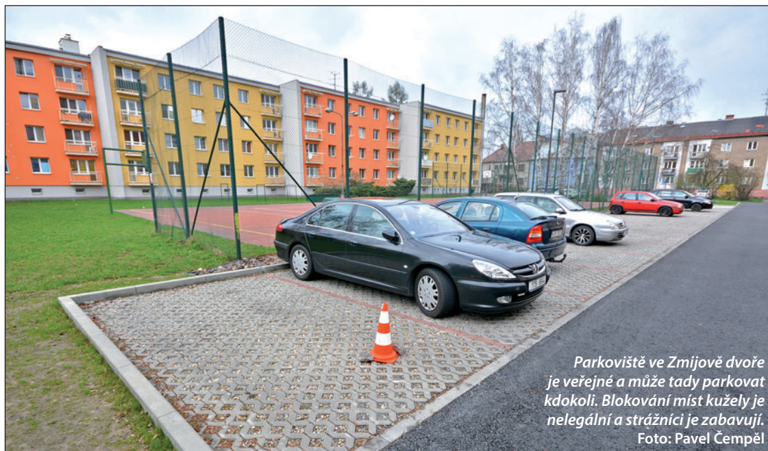
Parkoviště ve Zmijově dvoře je veřejné a může tady parkovat kdokoli. Blokování míst kužely je nelegální a strážníci je zabavují.

U kuželů to však nekončí, část řidičů si drze označila místa i cedulkami s espézetkami svých vozů. „Tabulky jsme nechali z plotů odstranit a hlídky se zaměřují také na kužely. Sbírají je a odvázejí do městských ztrát a nálezů. Když si je majitelé přijdou vyzvednout, důrazně je upozorníme, že na zá-