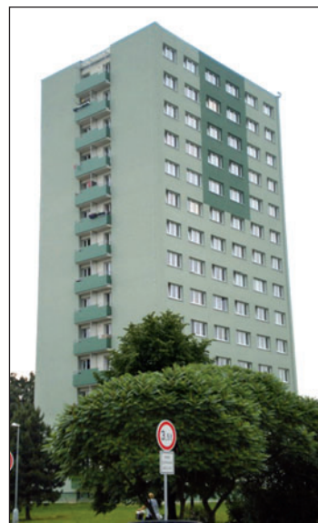
V tomto domě v Mírové ulici 1016 se licitují dva byty 1+3. Jeden 15. a druhý 17. května.

• Byt 1+3, ul. Osloboditelů 1019 , číslo bytu 43, I. kategorie, 11. nadzemní podlaží. Zateplený věžový dům v blízkosti školy, školky, zdravotního střediska a supermarketu. Možnost parkování u domu. Dům s funkcí domovníka. Byt s balkonem