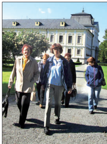
Ocenění Bohumínáci navštívili v rámci oslav Mezinárodního dne seniorů mimo jiné také zámek v Kravařích.

První říjen patří dříve narozeným, připomíná se Mezinárodní den seniorů. A oslavy probíhaly i na severu Moravy. Krajská rada seniorů uspořádala pro zástupce jednotlivých organizací návštěvu kulturních památek. Vyvrcholením pak byl společenský večer s udílením cen. Jednu z nejprestižnějších obdržel i Senior klub Bohumín. Je neaktivnějším spolkem v kraji za uplynulý rok.