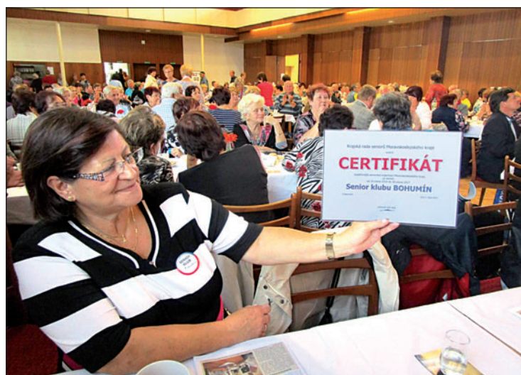
Společenská část setkání se odehrávala v Hlavnicích.