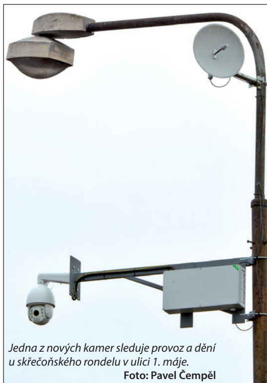
Jedna z nových kamer sleduje provoz a dění u skřečošského rondelu v ulici 1. máje.

Důvod letošního rozšiřování systému je trochu jiný. Trojice kamer se tentokrát zaměří na dopravu, konkrétně na příjezdové komunikace do města. Jedna se nachází v Šunychelské ulici u mostu nad dálnicí, druhá je u plastového kruhového objezdu ve Skřečoni. Třetí kamera bude sledovat rozcestí v Záblatí. Novinky přišly na necelých 400 tisíc, z čehož část pokryla také zvýšení kapacity záznamového serveru, kam se ukládají nahrávky z kamer. „S přibývajícím počtem kamer rostlo také množství záznamů, jenže tím se zároveň zkracovala doba jejich uchování. Server není »nafukovací«. Po kompletní modernizaci kamerového systému před pěti lety jsme dokázali nahrávky uchovávat celý měsíc. Letos už nám úložiště stačilo stěžit na deset dnů. Proto jej bylo nutné rozšířit,“ vysvětlil ředitel městské policie Karel Vach.