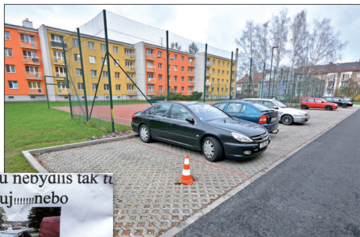
Situace ve Zmijově dvoře se vyhrtila. Po zábořech parkovacích míst kužely došlo i na výhrůžky.

Jablkem svárů byly dopravní značky u obou vjezdů do Zmijova dvora – zákaz vjezdu s dodatkovou tabulkou »mimo dopravní obsluhu«. Za zákona tak do dvora mohou kromě zásobování, záchranářů, údržby a podobně vjíždět (a parkovat) i vozidla, jejichž řidiči, popřípadě provozovatelé, mají v místech bydliště, sídlo nebo garáž. A právě kvůli této formulaci se šoféři vzájemně osočovali a udávali. Kdo tam skutečně bydlí, kdo má být pronajatý, kdo má vchod do dvora či na ulici...? Spory