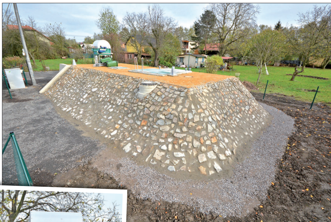
ČOV, která disponuje nejmodernějšími technologiemi, budou posléze provozovat Severomoravské vodovody a kanalizace (SmVaK).

Odvádět splašky z nejvzdálenějšího koutu Vrbice na ČOV v Kopytově by bylo technicky i finančně nesmírně náročné. Proto padla volba na