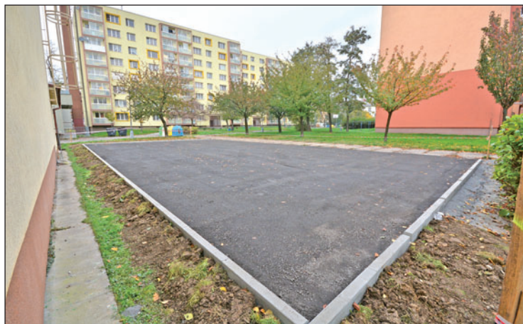
Na nové odstavné ploše ze ztuhlého recyklátu vedle Kostelní ulice zaparkuje až dvacet aut.