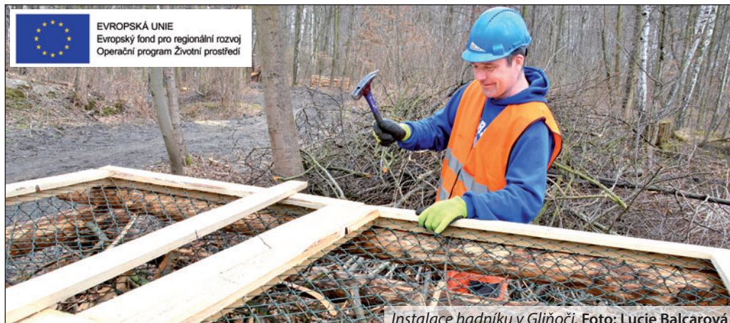
Instalace hadníku v Gliňoči.

Proměna Gliňoče potrvá do března příštího roku. Díky odtěžení nánosů ze zanesených vodních ploch se takélepší odtokové poměry v lokalitě, a to přibližně o jeden tisíc kubíků. Nové tůňky s rozlohou 2 200 metrů čtverečních budou navíc průtočné. Toto opatření sice nedokáže případnou povodeň zcela zastavit, ale bude umět zpomalit průtok i odtok vody. (balu)