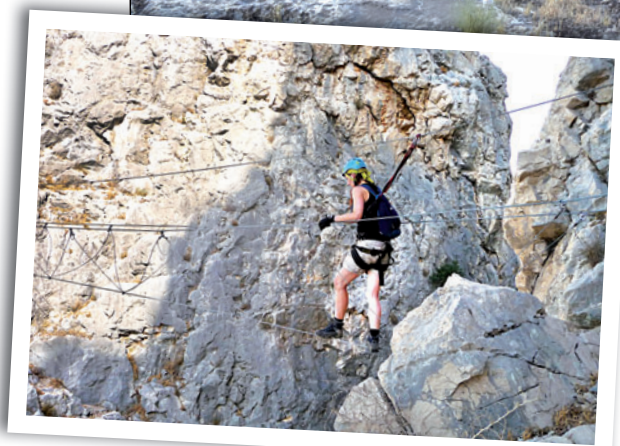
▲ Zámek Castillo de Peñarroya. ◀ Ferrata El Chorro.

přebudována na turistický park s betonovými vzdušnými cestami a zábradlím, po kterých se denně prochází tisíce turistů v sandálech. Samozřejmě po zaplacení vstupného. To nás nebere. Nás láká skutečná ferrata El Chorro, která vede skalními stěnami nad turistickou trasou. Věděli jsme, že musíme vyrazit brzy,