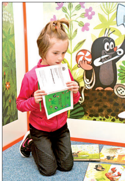
Postavičky Zdeňka Milera zabavily už několik generací. Tentokrát to byly bohumínské děti, například prvňáčci ze základní školy ČSA.

Foyer kina se proměnilo v království kreslíře Zdeňka Milera. Součástí interaktivní výstavy pro děti z mateřinek a menší školáky tak byl nejen zmíněný Krteček, ale také cvrček, štěňátko nebo Kubula a Kuba Kubikula. Mezi panely ve tvaru otevřené knihy s reprodukcemi ilustrací čekaly na malé návštěvníky skládačky, puzzle, kostky nebo raketa. Každé dítě vyfasovalo sešit a plnilo zábavné úkoly. Na jednom stanovišti bylo třeba složit obrázek, na dalším projít bludištěm a jinde zase vytvořit z dlaždic chronologický příběh. Za správně vyřešený kvíz dostávaly děti razítka do bloku, a tak se předháněly, kdo jich bude mít rychleji co nejvíc. Na interaktivní výstavu mířily každý den děti ze škol a školek, během víkendu 14. a 15. dubna ji mohli navštívit a zasoutěžit si rodiče s malými potomky. (tch)