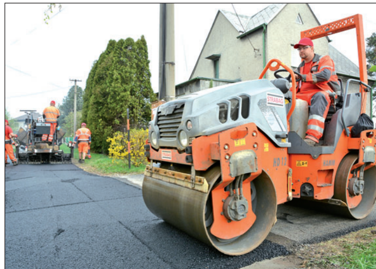
Rok ve znamení oprav bohumínských vozovek. Frézování a asfaltování se rozběhlo ve Starém Bohumíně.

objem ploch historický rekord. Šest milionů půjde na kompletní rekonstrukce, milion na opravy výtluků. (tch)