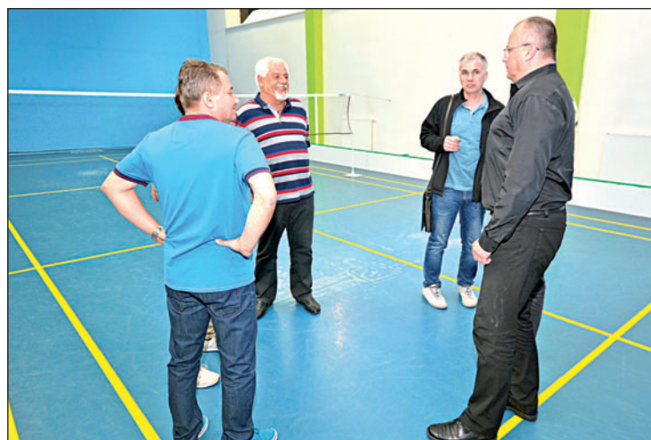
Před rozhodnutím o koupi si byli zastupitelé a vedení Bosporu interiér Sportcentra důkladně prohlédnout.

Sportcentrum momentálně disponuje třemi hřišti pro badminton, squashovým kurtem,