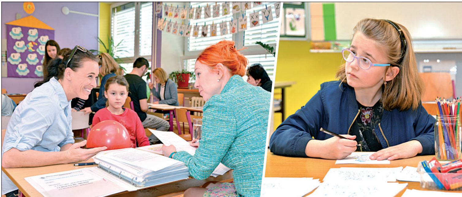
První školní test. Děti učitelkám předvedly, co už všechno umí a zda jsou na nástup do první třídy připravené. Foto ze školy ČSA a Bezručovy.

Už se jim to blíží. Hravá a bezstarostná etapa dětství pomalu končí. Za pár měsíců začne nová éra, kdy bude třeba do makoviček nasát první vědomosti a učit se zodpovědnosti. Jsou předškoláci připravení a dostatečně »zralí«? Na to měly dát odpovědi zápisy do prvních tříd.