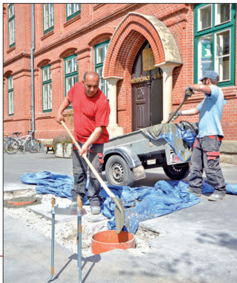
Dělníci připravili základy, do nichž se uchyťí nové demontovatelné stožáry.

Pamětní deska bude vhodným místem k pořádání různých vzpomínkových akcí. Proto u ní přibude prostor k pokládání květin a především se před radniční budovou objeví dva zcela nové stožáry. Vlát na nich bude při slavnostních příležitostech státní vlajka a městský prapor. V souvislosti s instalací zcela nových stožárů prošly revizí i dva stávající u hlavní budovy. Nejen že už se jeden z nich nakláněl, ale navíc se ukázalo, v jak špatném stavu jsou. Na kovových tyčích se už silně podepsala rez. Proto musely oba pryč a jejich místo zaujmou rovněž nové kusy, tentokrát z odolného sklolaminátu. Všechny nové sloupy budou navíc demontovatelné, takže v případě jejich závady nebude nutné rozbíjet dlažbu a beton. Jednoduše se vymění kus za kus. (tch)