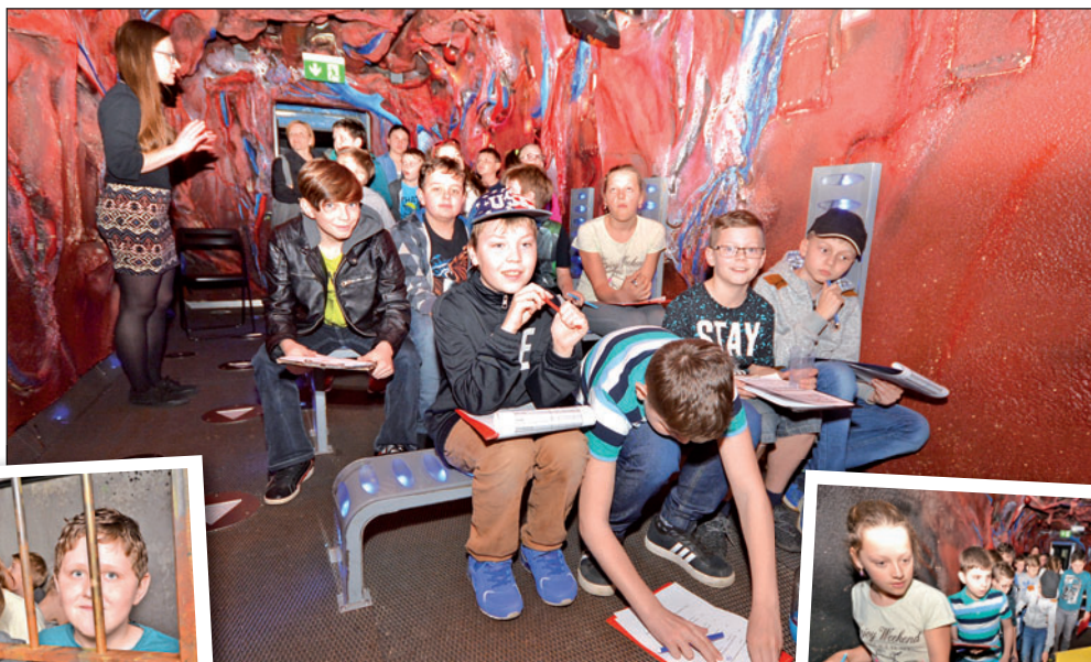
Interiér protidrogového vlaku vypadá realisticky. Návštěvníci, v tomto případě žáci skřečošské školy, jsou doslova vtaženi do děje tragického drogového příběhu.

„Protidrogový vlak je jednou z významných součástí naší protidrogové kampaně. Chceme jeho prostřednictvím upozornit nejen děti, ale hlavně jejich rodiče na drogovou hrozbu. Tu vnímáme velmi vážně. Předloni měl vlak