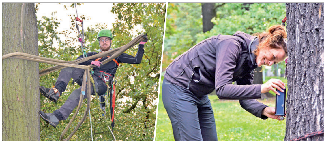
Nejvíce tahových zkoušek probíhalo v městském parku. Specialisté instalovali na stromy inklinometry, které měří náklon kořenové báze, a elastometry, ty zase změří posunutí dřevních vláken.

Výsledky měření a simulace budou známy v průběhu nejbližších týdnů. Město si od nich slibuje potvrzení nebo vyvrácení vizuálních prověrek, protože nechce hodnotné stromy zbytečně kácet. (tch)