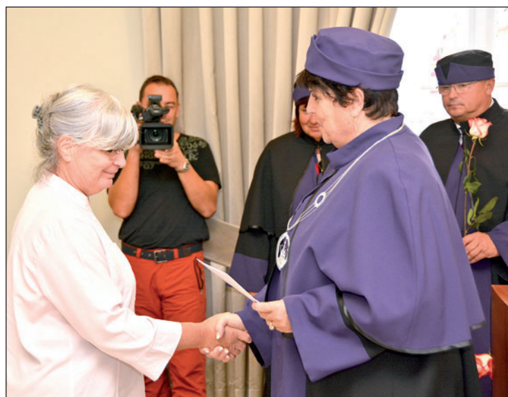
Slavnostní přijetí nových studentů proběhlo 3. října v obřadní síni bohumínské radnice.

Univerzita třetího věku v Bohumíně funguje od roku 2007, od roku 2011 se projektu účastní také Rychvald. Dosud se do studia zapojilo více než 180 zájemců. (red)