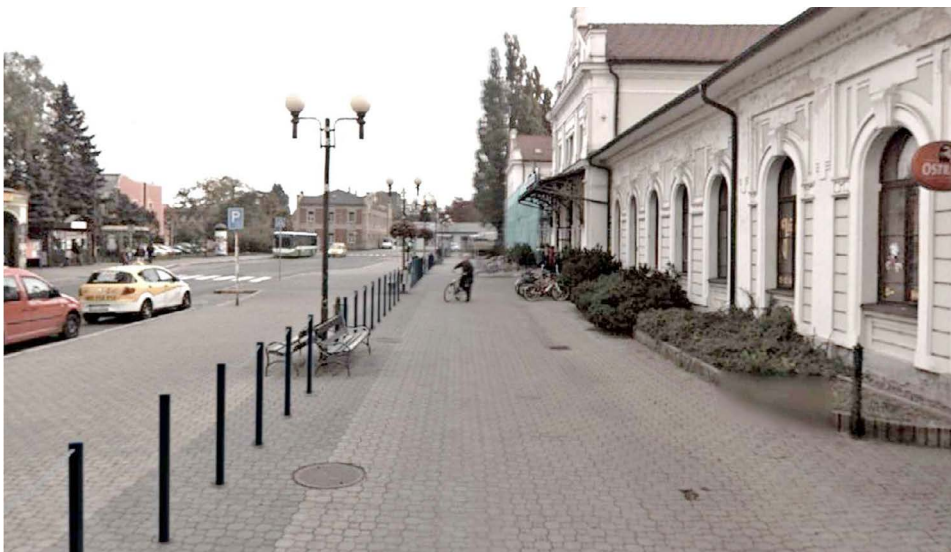
Návrh protiteroristických opatření u nádraží.

Navržené řešení ale narazilo na nesouhlas radnice. Nejde ani tak o minimální pravděpodobnost terorismu v Bohumíně, ale o estetiku. Ocelové zátarasy by »zohydily« přednádražní prostor, jehož úpravu a modernizaci město právě připravuje. Vzniknout tady má dopravní terminál a součástí projektu je i úprava vydlážděné plochy pro pěší. Dočká se nových povrchů, veřejného osvětlení, laviček, zkrátka aby měla plocha hezčí a důstojnější podobu. Ochranné sloupy s řetězy do této koncepce absolutně nezapadají. Město své stanovisko tlumočilo SŽDC, která jej respektuje a od zátarasů s největší pravděpodobností ustoupí. V budoucnu se zaměří především na další opravy historické budovy. (tch)