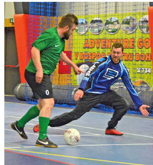
Futsal v bohumínské sportovní hale zdomácněl. Bospor Futsalmania Tournament zahrnuje devět turnajů a velké finále.