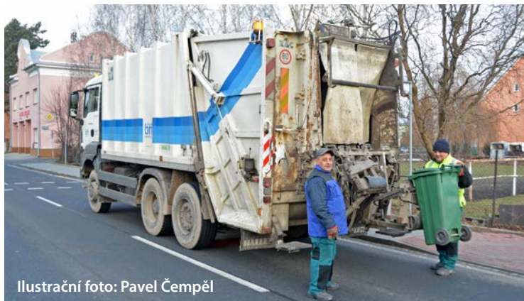
Ilustrační foto: Pavel Čempěl

Náklady na vývoz a zpracování odpadu stále stoupají, což se pochopitelně odráží i v cenách, které za vývoz popelnic hradí obyvatele. Také Bohumiňáci si letos připlatí. Úhrada za vývoz klasických popelnic ve čtrnáctidenních cyklech u rodinných domů se zvyšuje o 4,8 procenta, týdenní vývoz sídlištních kontejnerů zdražuje o 8,5 procenta.