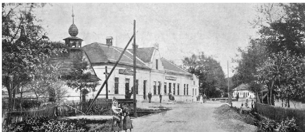
První zmínka o Skřečoni, tehdy osadě, pochází z roku 1305 a letos od ní uplyne 715 let. Historický snímek z počátku minulého století zachycuje kapličku a hospodu U Lembergera. Stála v místech dnešního »šišatého« kruhového objezdu.

715 let obce Skřečoch (1305) 540 let osady Kopytov (1480) 165 let železniční trati Bohumín – Petrovice u Karviné (1855) 135 let postavení roury společnosti Alberta Hahna (1885) 120 let Klášterní školy kongregace Chudých školských sester de Notre Dame, dnes budova SŠ Bohumín (1900) 115 let fary římskokatolického kostela (1905) 110 let základní školy ve Skřečoni • mlýna a továrny na zpracování rýže, později Balírný v Lidické ul. (1910) 105 let farní budovy ve Starém Bohumíně, dnes Charitní dům pokojného stáří sv. Františka tělovýchovné jednoty Sokol Bohumín • české mateřské školy ve Starém Bohumíně 95 let pomníku padlým ve světových válkách v parku P. Bezruč (1925) 85 let pomníku padlým občanům Skřečone v 1. světové válce (1935, zrekonstruován 2015)