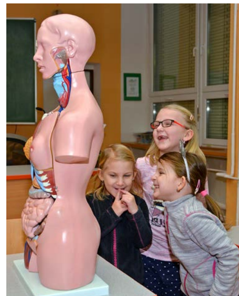
Zatím byli předškoláci v ZŠ ČSA na »ekurzii«, po prázdninách už tady usednou do lavic.