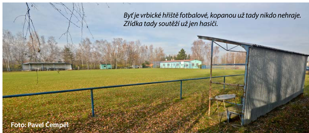
Byť je vrbické hřiště fotbalové, kopianou už tady nikdo nehraje. Zřídka tady soutěží už jen hasiči.

Zaboří se ještě někdy do vrbického pažitů kopačky, zaburáci z ochozů zvolání »gól«? Těžko říct. Vrbický fotbalový klub ukončil po 70 letech činnost v roce 2016. Hřiště pak k tréninkům využíval sporadicky fotbalový Bohumín, ale i jeho působení loni skončilo. Areál přešel od letošního roku pod správu města a jeho společností. Nyní se hledají možnosti dalšího využití.