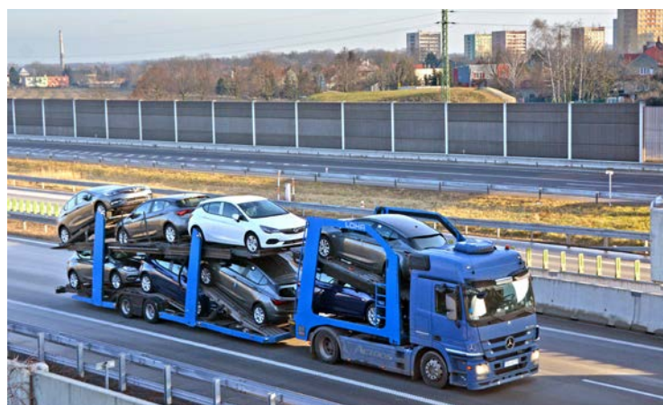
Provoz na dálnici stále houstne a kravál z dopravy trápí obyvatele. ŘSD letos provede další měření hluku. Postup konzultuje s krajskou hygienickou stanicí včetně výběru sledovaných míst.