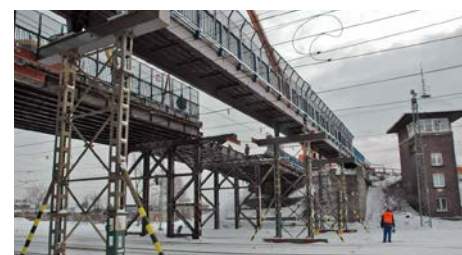
Počátkem roku 2010 šel k zemi ocelový skřečochský most. Ten vyrostl v 50. letech 20. století, kdy nahradil dřevěný most z roku 1887.

5 let železničního přejezdu v Drátovské ulici, který nahradil podjezd (myší díru) • dokončení demolice všech drážních domů v pudlovských Lounech • návrat kostelních zvonů z roku 1620 do Starého Bohumína, zkonfiskovaných v roce 1942 nacisty • otevření zrekonstruovaného hotelu Pod Zeleným dubem, původně Grüner Baum z roku 1907 • kompletní rekonstrukce náměstí Svobody ve Starém Bohumíně • vrácení původního názvu Jubilejní most císaře Františka Josefa I. hraničnímu mostu • nových garáží profesionálních hasičů, dokončení celkové rekonstrukce stanice (vše 2015)