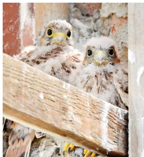
V otvoru, který stavbaři využívali ke vstupu na půdu, se uhnízdily poštolky.