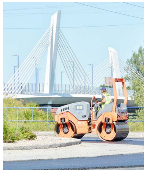
Během rekonstrukce skřečošského rondelu vedly objízdné trasy přes Novou Ves a Záblatí.