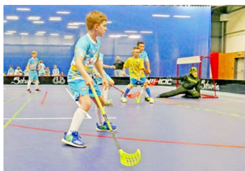
Sportovní hala hostila florbalový turnaj mladších žáků.

Nejprve zahájí mistrovskou sezonu starší žáci, kteří se 13. září představí v domácí hale proti Petrovicím a Frenštátu. Po týdnu vstoupí do krajské ligy i mladší žáci, kteří se 19. září utkají s Opavou, Frýdkem-Místkem a havířovskými celky SFK a Torpedo. Ve stejný den čeká první turnaj i dorostence v Horní Suché. Až později startují benjamínci – příprava zahajuje doma 3. října a elévové vstoupí do soutěží až v prvním listopadovém víkendu v Ostravě. (bir)