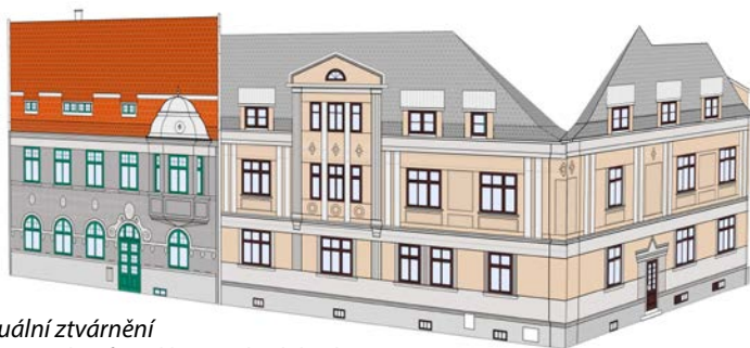
Vizuální ztvárnění rekonstrukce fasád historických budov.