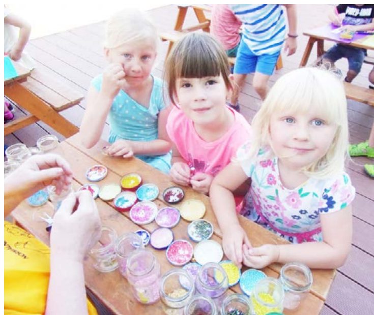
Pilotní setkání ve skřečonské mateřince.