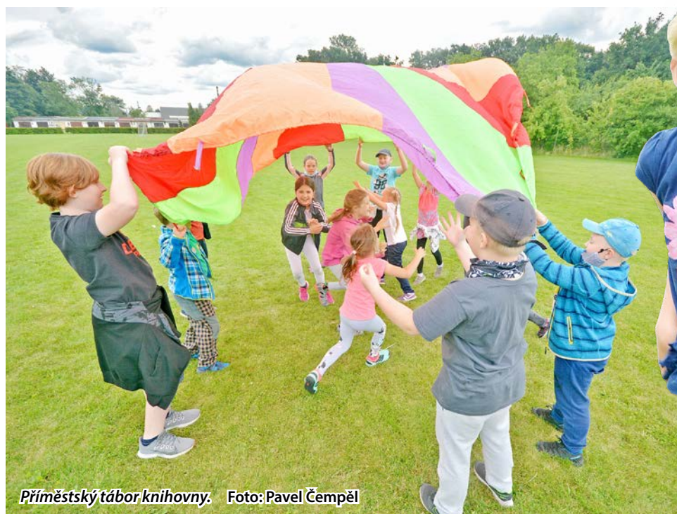
Příměstský tábor knihovny.

Mnoho tradičních letních akcí zhatila opatření vlády a hygieniků. Uskutečnit se nemohl ani každoroční Prázdninový kolotoč, seriál výletů a her pro děti. Na situaci ovšem zareagovaly bohumínské instituce a posílily nabídku letních táborů.