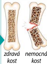
zdravá kost nemocná kost

Řídnutí kostí je zákeřná nemoc NEPODCEŇUJTE PREVENCI!