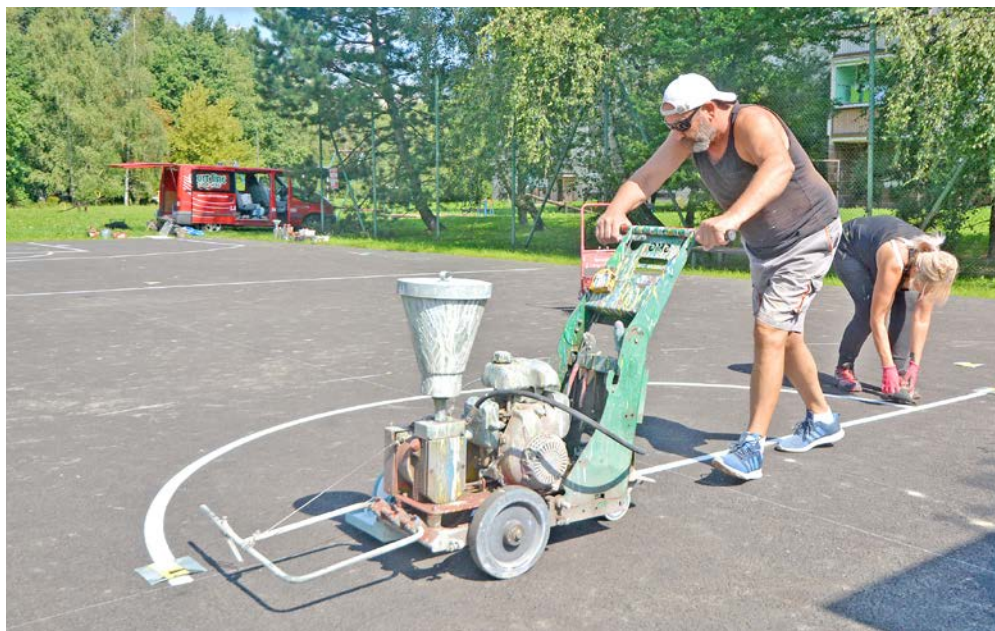
V červenci dostalo hřiště na sídlišti v Tovární ulici nový povrch, nyní přibýly i lajny pro různé druhy her.

Kdo si hraje, nezlobí. Pokud ovšem chodí na hřiště opravdu sportovat, ne zevlovat a dělat lumpárny. Pro první skupinu, tedy milovníky pohybu, radnice aktuálně zmodernizovala trojici hřišť a plácků. V Gliňoči a na sídlištích v Tovární a u křižovatky Bezručovy a Revoluční ulice.