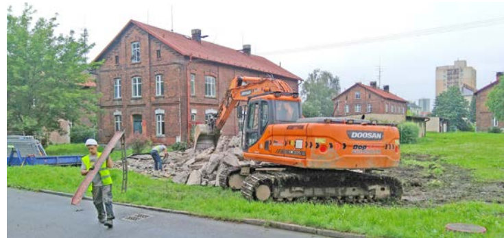
V létě zmizely kůlny a septiky, s nimiž se při přestavbě nepočítá.