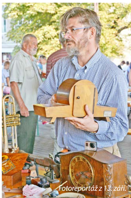
Fotoreportáž z 13. září.