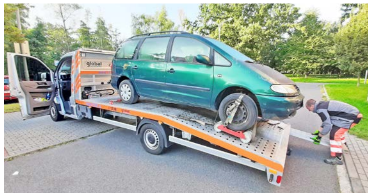
Vraky s propadlou STK město postupně odstraňuje z parkovišť. Foto odtahu z parkoviště u bývalého hoteláku, dnes Slunečnice.

míně se iniciativy chopila městská policie. U aut, k nimž měla podněty od občanů či z pochůzkové činnosti, a která dlouhodobě stála na jednom místě, ověřila platnost STK. Pokud mělo nějaké děle než půl roku propadlou kontrolu, vyzvala písemně jejich majitele ke sjednání nápravy. Tedy aby STK obnovili, nebo vozidlo odstranili z veřejné plochy. V první fázi šlo o deset vozů, přičemž si dva vlastníci automobilů skutečně odvezli. U ostatních běžela dvouměsíční lhůta, po jejímž uplynutí může správce ko-