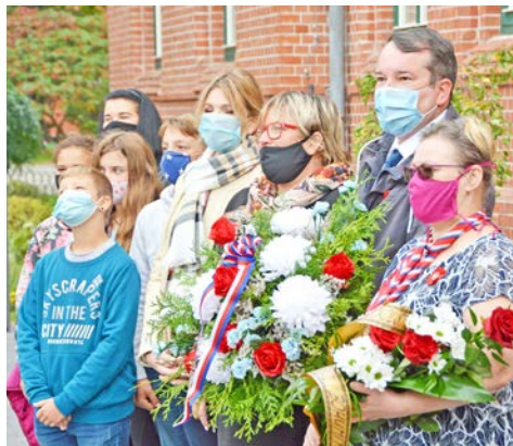
Vyvěšení praporů u radnice se zúčastnili představitelé města, zástupci místních jednot i župy a také žáci Masarykovy školy.