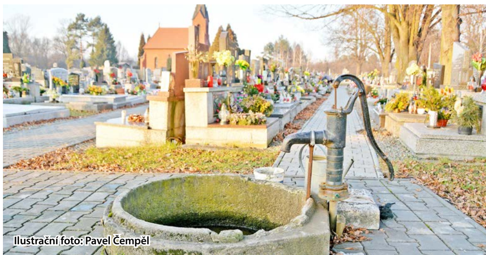
Ilustrační foto: Pavel Čempěl