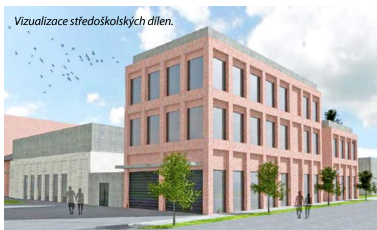
Vizualizace středoškolských dílen.

Rozvoj Střední školy Bohumín je jednou z priorit jejího zřizovatele, Moravskoslezského kraje. Ať už jde o zkvalitňování vzdělávání nebo investice. Jednou z připravovaných je stavba nových dílen a tělocvičny.