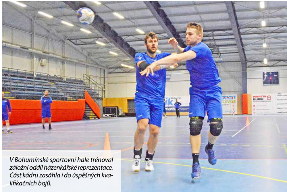
V Bohumínské sportovní hale trénoval záložní oddíl házenkářské reprezentace. Část kádru zasáhla i do úspěšných kvalifikačních bojů.

Není obvyklé, aby v Bohumíně pobývala a trénovala česká reprezentace, ale v této zvláštní době je možné vše. V březnu a na sklonku dubna tak areál Bosporu poskytl zázemí reprezentačnímu týmu mužské házené. Připravoval se tady na kvalifikační utkání na mistrovství Evropy 2022, které se uskuteční v lednu na Slovensku a v Maďarsku.