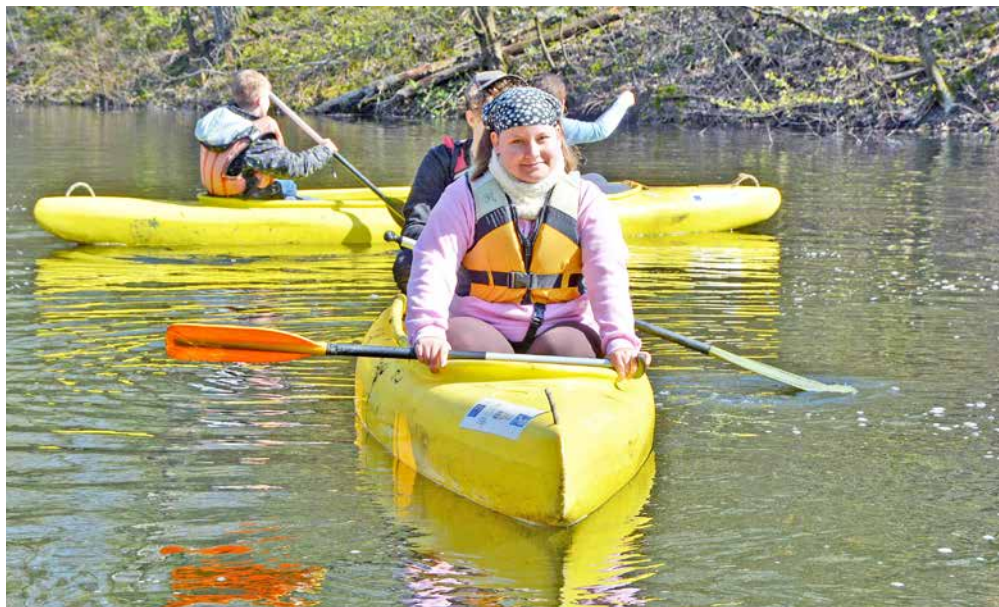
Spolek Vodáci Odry a Olše spojil výcvik s úklidem skřečošského Gliňoče.

Jaro je časem gruntování. Spolky i party nadšenců, kterým není lhostejné životní prostředí, vyrazily do přírody, aby ji zbavily odpadků. Zaměřily se hlavně na okolí vodních ploch. Očistou prošel Gliňoč i obě velká jezera. Radnice poskytla dobrovolníkům pomůcky, BM servis zajišťoval odvoz naplněných pytlů.