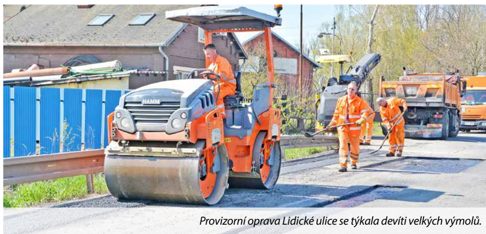
Provizorní oprava Lidické ulice se týkala devíti velkých výtluků.

Správa silnic Moravskoslezského kraje (SSMSK) nechala v uplynulých dnech opravit devět nejrozsáhlejších děr v Lidické ulici. Silničáři poškozenou živici vyřízli, místa vyčistili a znovu vyasfalovali. Jde však pouze o provizorní řešení. Životnost záplat je omezená, navíc velké množství menších prasklin a poškození vozovky zůstalo bez opravy.