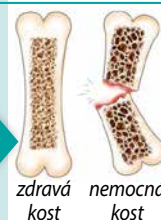
zdravá kost nemocná kost

Rídnutí kostí je zákeřná nemoc NEPODCEŇUJTE PREVENCI!