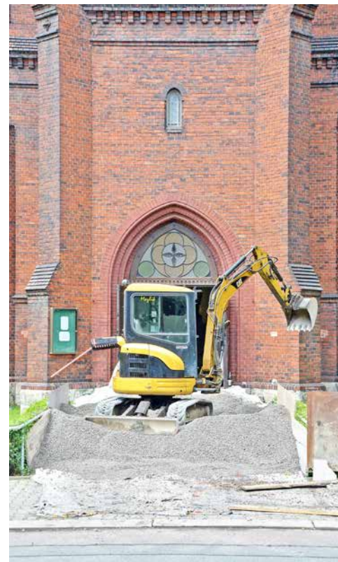
Zvlněná a popraskaná podlaha evangelického kostela ve Štefánikově ulici potřebovala rekonstrukci.