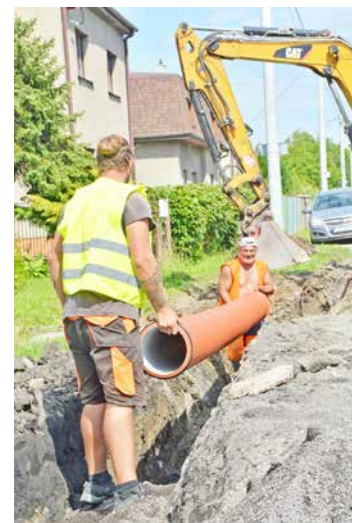
Chodník vyrostе nad stávajícím příkopem, takže je nutné současně vyřešit odvádění dešťovky. Pod chodník proto firma ukládá potrubí dešťové kanalizace.