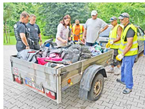
Při inventuře putovalo všechno haraburdí do smetí a boxy dostaly nové zámky.