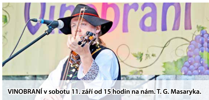
VINOBRANÍ v sobotu 11. září od 15 hodin na nám. T. G. Masaryka.