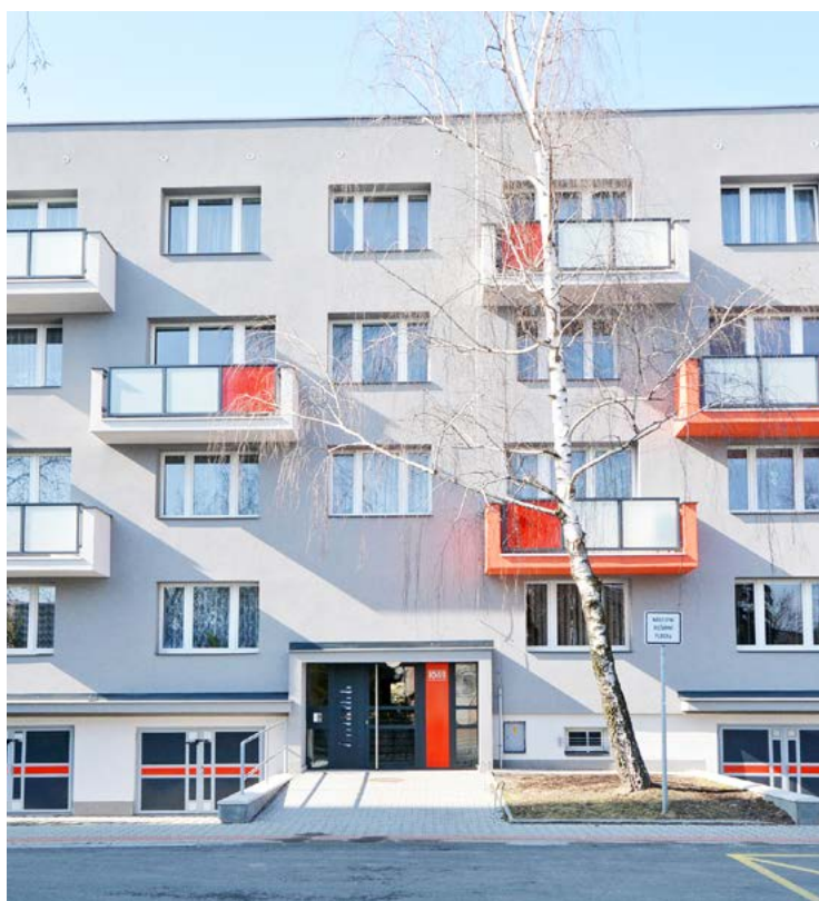
V domě v ul. Čs. armády 1049 se bude licitovat byt 2+1 o velikosti 59,75 m 2 . K bytu ve 4. nadzemním podlaží náleží sklepní kóje i balkon. Licitace se uskuteční 3. října, prohlídky jsou připraveny na 26. a 27. září.