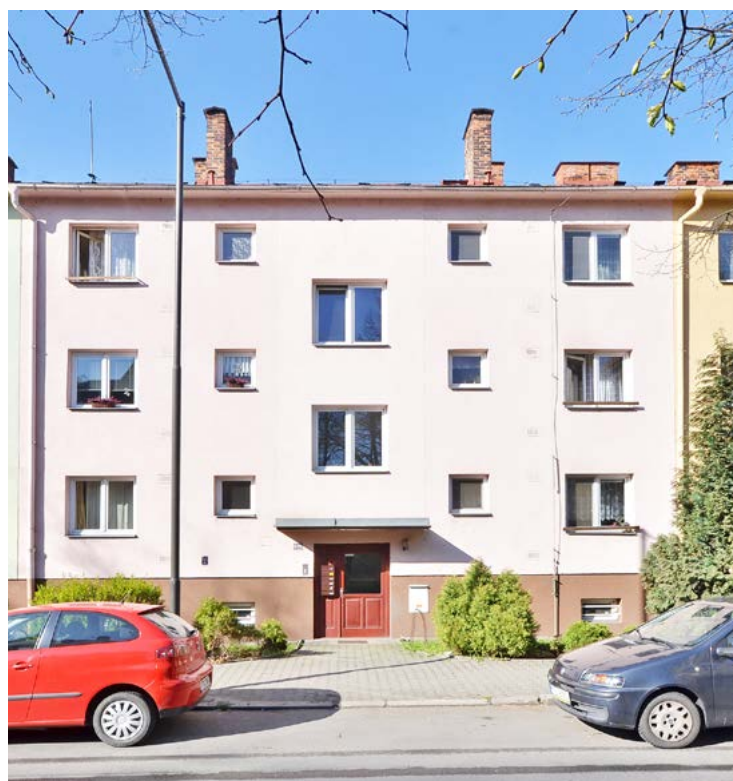
V nízkopodlažním domě v ulici Masarykova 929 v centru města je k dispozici byt 1+1 o velikosti 35 m 2 . Nedaleko domu se nachází vlakové nádraží, obchody, školy i školky. Licitace bytu se uskuteční 12. října, zájemci si mohou byt prohlédnout 5. a 6. října.