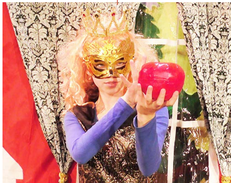
Divadlo KK se 26. února v Bohumíně představí s pohádkou O Sněhurce a sedmi trpaslících.

6.3. v 17 hodin VERNISÁŽ FOTOGRAFIÍ: JIŘÍ HANZEL. Foyer kina.