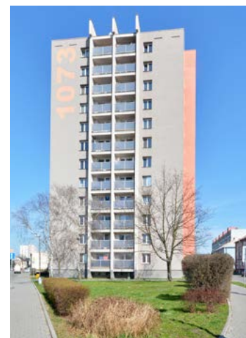
V ulici na adrese Štefánikova 1073 se bude dražit byt 1+0, který se nachází ve 3. nadzemním podlaží věžového domu. Byt s balkonem o celkové velikosti 30 m 2 se nachází ve věžovém domě poblíž supermarketu Penny. Prohlídka bytu se uskuteční 15. března mezi 14:45 až 15:00 a 16. března v době od 11:15 do 11:30. Licitace bytu se koná 20. března v 16:30 hodin.