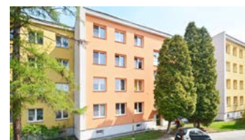
Do licitací míří byt o velikosti 3+1 v nízkopodlažním domě poblíž centra města v ulici Čáslavská 193. Byt o velikosti 60 m 2 si mohou zájemci prohlédnout 15. března mezi 14:30 až 14:45 a o den později od 11:00 do 11:15. Licitace bytu se koná 20. března v 16:15 hodin.